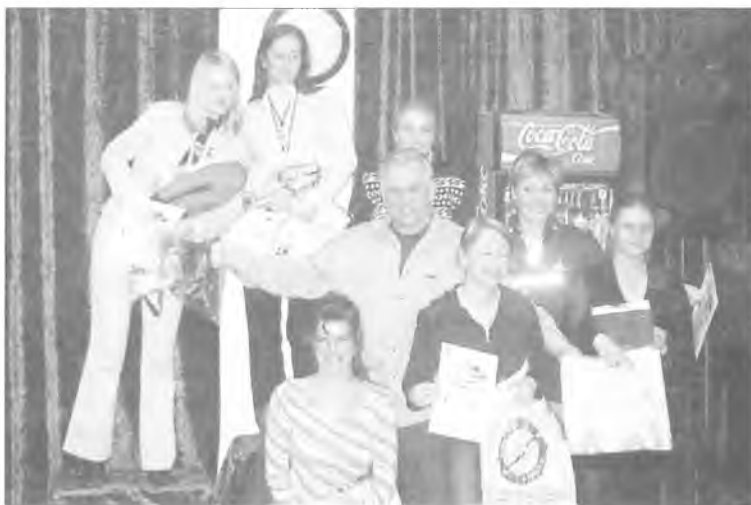
Rozdanie nagród w - może nie najwyższej, ale za to - najładniejszej kategorii.