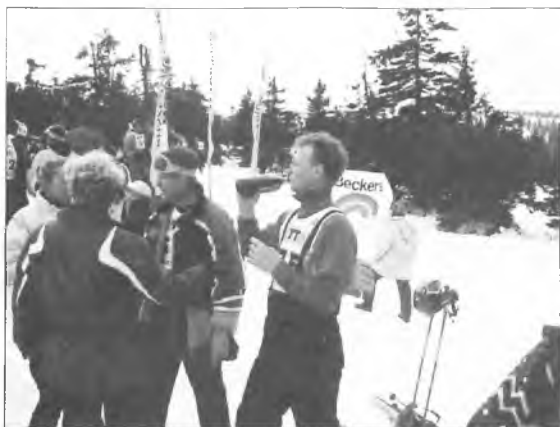
Najlepszy w kategorii „open” przytłopony na stosowaniu dopingu...