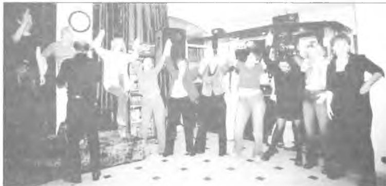
Dobra zabawa trwała nie tylko na stoku...