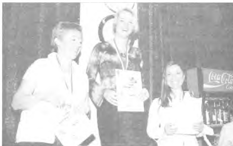
Radość ze zwycięstwa...