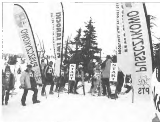
Zawodnicy na starcie.