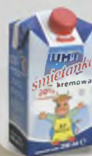
Kartonik po śmietanie