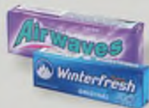
Guma do żucia