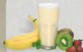
Skórka od banana