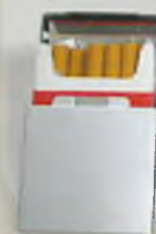
Pudełko od papierosów