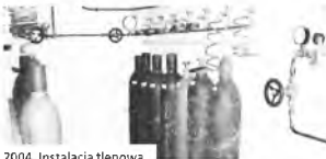
2004. Instalacja tlenowa