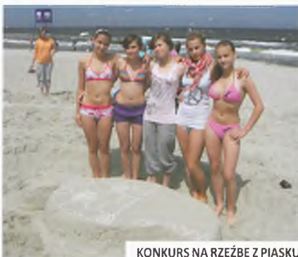
KONKURS NA RZEZBĘ Z PIASKU