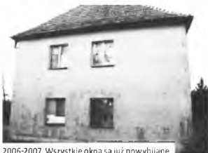
2006-2007. Wszystkie okna są już powybijane