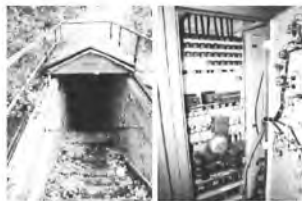
2009. Wejście do bunkra 2009. Instalacja elektryczna