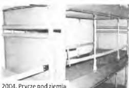
2004. Prycze pod ziemią