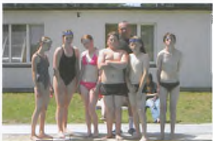
UCZESTNICY ZAWODÓW PŁYWACKICH

☞ | Między 22 czerwca i 3 lipca grupa 35 dzieci wypoczywała na kolonii w Mrzeżynie. Nadmorskie wakacje, podobnie jak obóz w Szczawie, zorganizował dzieciom Urząd Miejski.