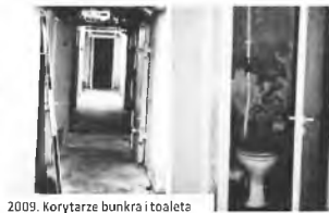
2009. Korytarze bunkra i toalety