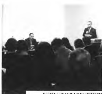
DEBATA SPOŁECZNA NAD STRATEGIĄ

☞ Rada Miasta uchwaliła Strategię Rozwiązywania Problemów Społecznych Puszczykowa na lata 2009-2015. Dokument przyjęto na sesji 24 czerwca.