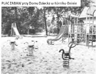
PLAC ZABAW przy Domu Dziecka w Kórniku-Bniniu