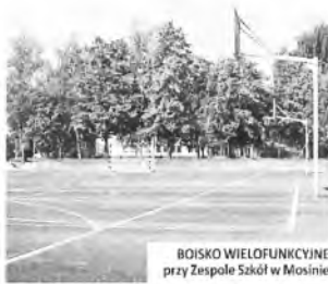
BOISKO WIELOFUNKcyjne przy Zespole Szkół w Mosiniu