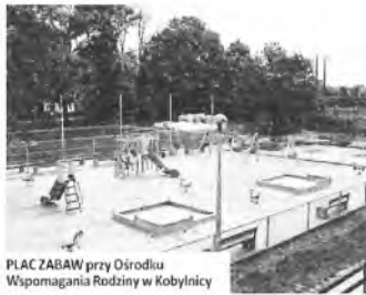
PLAC ZABAW przy Ośrodku Wspomagania Rodziny w Kobylnicy

Od 1 lipca 2009 r. Starosta Poznański zaprasza dzieci i młodzież do 18. roku życia na bezpłatne zajęcia sportowo-rekreacyjne, które będą realizowane w dziewięciu strefach rekreacji dziecięcej, co tydzień od poniedziałku do soboty przez okres wakacji.