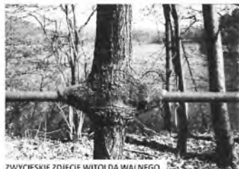
ZWYCIESKIE ZDJĘCIE WITOLDA WALNEGO