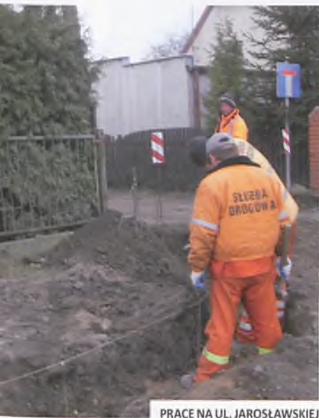
PRACE NA UL. JAROSŁAWSKIEJ