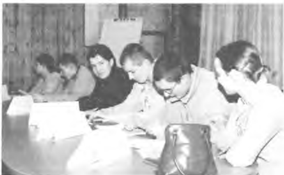
MRM podczas pracy nad regulaminem