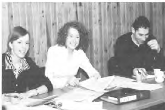
Zarząd Młodzieżowej Rady Miasta w szampańskim nastroju