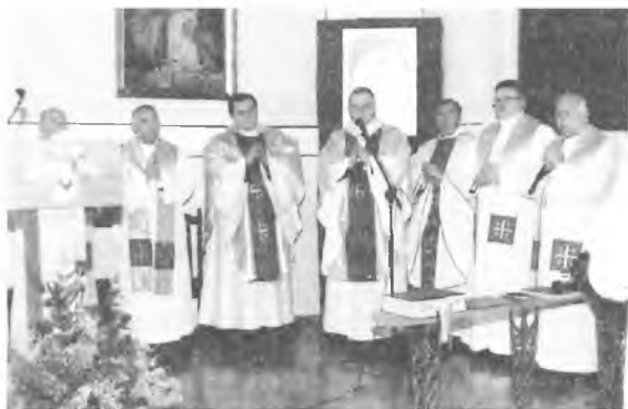
Jubileuszowa Msza Św. koncelebrowana