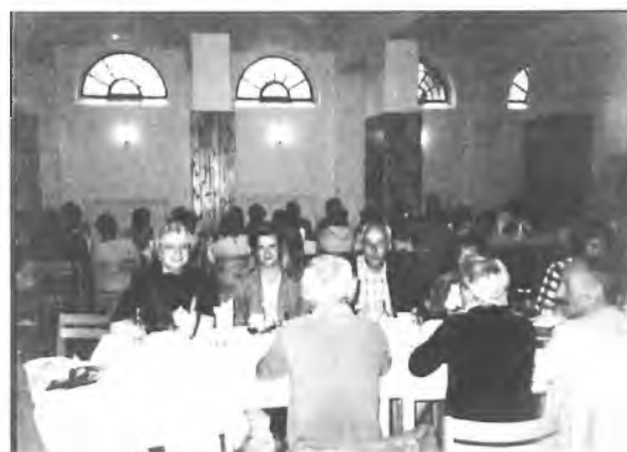
To już pożegnalne spotkanie przy kawie