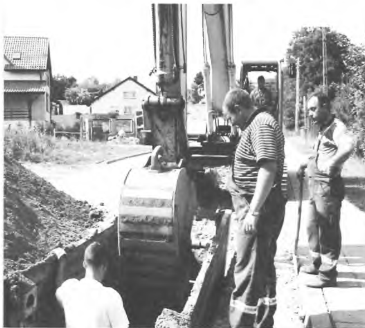
Prace przy kanalizacji na ulicy Jarosławskiej.

MŁODZIEŻOWA RADA MIASTA ZAPRASZA CZYTAJ NA STRONACH 9-10