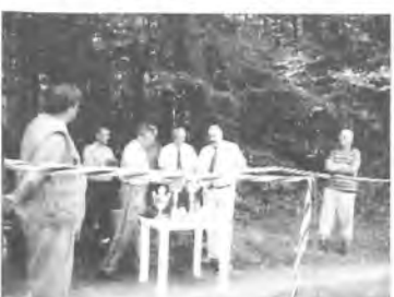
Zawody wędkarskie są okazją do spotkania towarzyskiego. red.