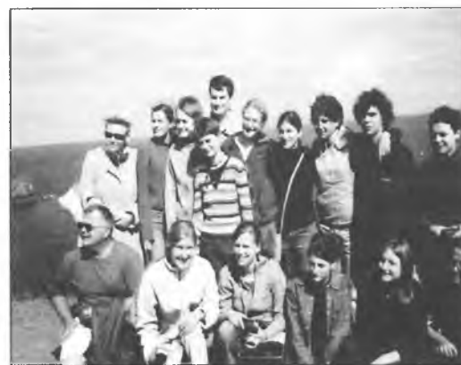
Nad Kanałem La Manche