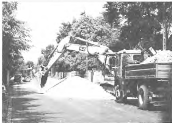
i ul. Kasprowicza.