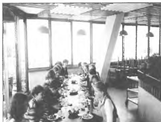
Smaczna przerwa w zajęciach