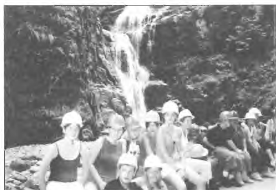
Wycieczka w Karkonosze - chwila odpoczynku