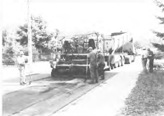
A na Piaskowej jest już kładziony asfalt.