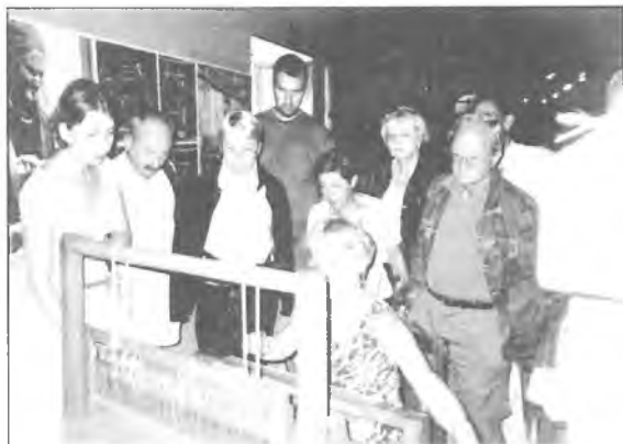
Muzeum w Szreniawie okazało się nie lada atrakcją