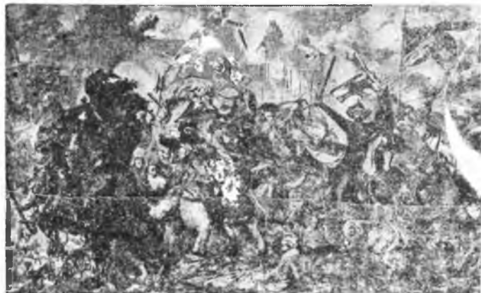
W związku ze zbliżającą się 529 rocznicą zwycięstwa nad wojska- mi krzyżackimi pod Grunwaldem i Tarasbergiem, reprodukuje jedno z arcydzieł malarstwa polskiego, mianowicie słynny obraz Jana Matejki „Bitwa pod Grunwaldem”

PRZED WIEKOPOMNĄ ROCZNICĄ ZWYCIĘSTWA POD GRUNWALDEM.