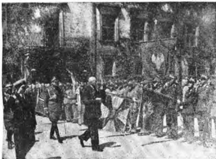
Pan Prezydent Rzeczypospolitej przed frontem pocztów sztandarowych b. ochotników armii polskiej.