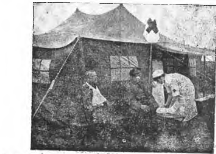
W całym kraju odbywa się obecnie Tydzień Propagandowy Polskiego Czerwonego Krzyża. Na zdjęciu akcja ratownicza PCK. przy namiocie polowym.