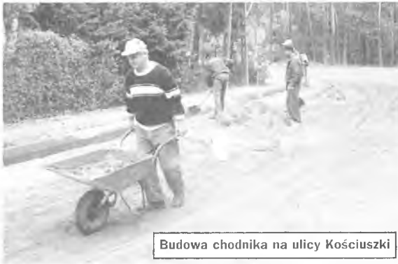
Budowa chodnika na ulicy Kościuszki