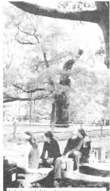
Lekcja pod dębami