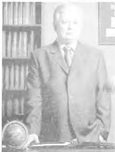
Lech Kaczyński 1487 głosów 32,6%