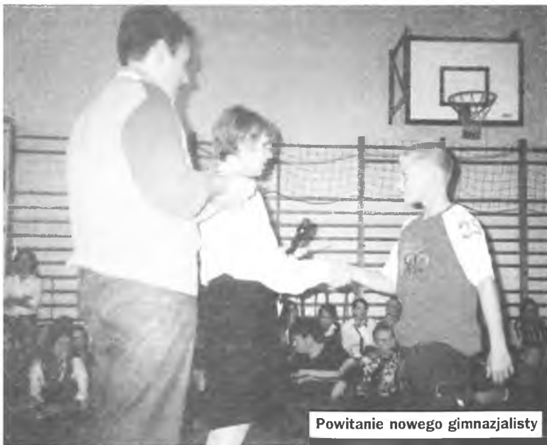
Powitanie nowego gimnazjalisty