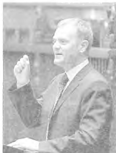
Donald Tusk 3081 głosów 67,4%

Podobnie jak podczas wyborów do Sejmu i Senatu, puszczykowie gremialnie stawili się w lokalach wyborczych. W I turze frekwencja wyborcza osiągnęła 59,1 %, a w II była jeszcze lepsza, bo ponad 62 %. To tym bardziej dobry wynik, jeśli porówna się go z frekwencją w Polsce, gdzie średnia wyniosła 50,9 %. Puszczykowie wykazali też dużo bardziej odpowiedzialną postawę, w porównaniu z Poznaniem, gdzie do urn poszło 61,9 % uprawnionych do głosowania.