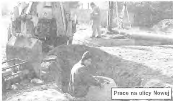
Prace na ulicy Nowej

Suchą nogą dotrą już niedługo do swoich domów mieszkańcy ulicy Nowej w Puszczykowie. W tym roku ułożone zostaną krawężniki oraz nawierzchnia nowo wybudowanego chodnika po obu stronach ulicy na długości blisko 200 m.