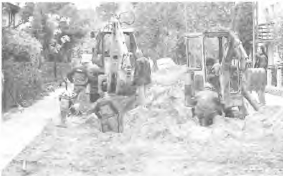
Kanalizacja deszczowa na ulicy Wąskiej

C oraz więcej ulic w Puszczykowie zyskuje nowe chodniki lub nawierzchnię. Na niektórych budowana jest także kanalizacja deszczowa.