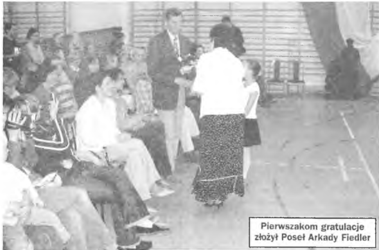
Pierwszacom gratulacje złożył Poseł Arkady Fiedler