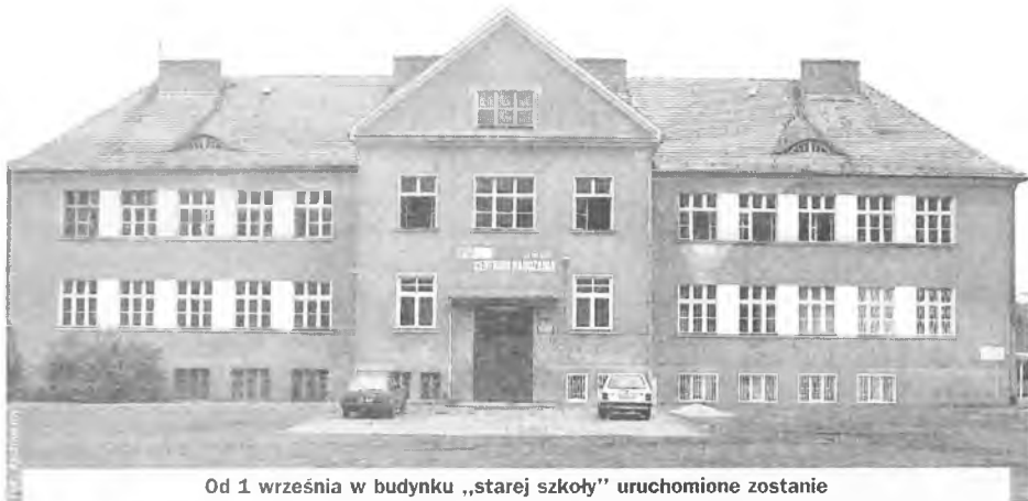
Od 1 września w budynku „starej szkoły” uruchomione zostanie Centrum Edukacyjno - Artystyczne „ABC Plus”