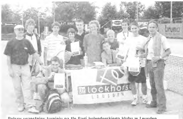
Polscy uczestnicy turnieju na tle flagi holenderskiego klubu w Leusden.

meczów. W przypadku deszczu (co niestety się zdarzało) mecze odbywały się w hali wyposażonej podobnie jak nasze Angie w 4 kryte korty. Codziennie wieczorem odbywały się różnego rodzaju gry i zabawy, podczas których wszyscy uczestnicy turnieju byli podzieleni na wielonarodowe grupy. Każdy uczestnik turnieju mieszkał w domu rodziny holenderskiej. Dzięki temu młodzież mogła poznać zwyczaje panujące w holenderskich