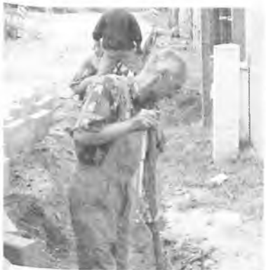
Prace na ul. Przecznicza

Obecnie trwają prace na ulicy Przecznicza. Opóźnienie rozpoczęcia robót na tej ulicy spowodowane