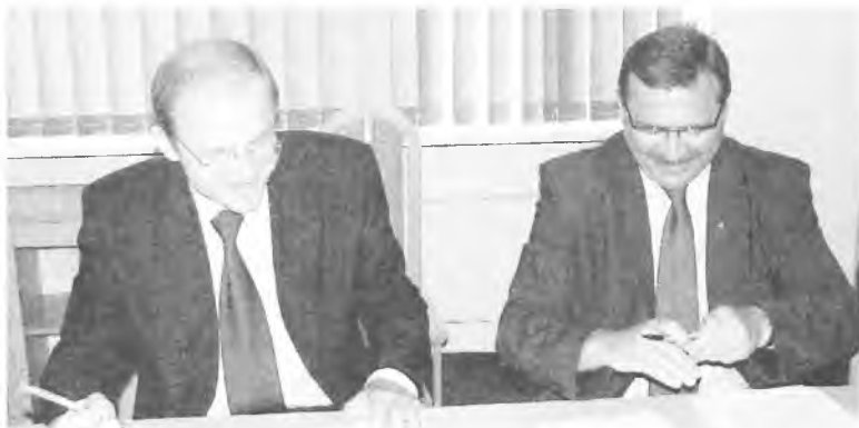
Uroczyste podpisanie umowy pomiędzy powiatem poznańskim a Narodowym Funduszem Ochrony Środowiska i Gospodarki Wodnej.

Ogrzewanie budynków i obiektów publicznych pochłania w Polsce znacznie więcej energii niż w krajach