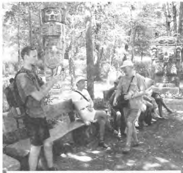
Chwila odpoczynku w Ogrodzie Tolerancji

osób niepełnosprawnych z terenu Wielkopolski. „Rajd Puszczyka” zorganizowany został przez Dom Pomocy Maltańskiej w ramach projektu, na który uzyskano dotację Powiatu Poznańskiego oraz Wojewody Wielkopolskiego. Niepełnosprawni uczestnicy Domu Pomocy Maltańskiej do wspólnej zabawy zaprosili uczniów z Zespołu Szkół Specjalnych z Bogdanowic, Zespołu Szkół z Parkowa, mieszkańców Domów Pomocy Społecznej z Lisówek i Pakówki.