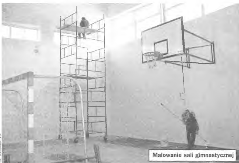
Malowanie sali gimnastycznej

Choć wciąż trwają wakacje, w puszczykowskich szkołach praca wre. Wiele miłych niespodzianek czeka uczniów Szkoły Podstawowej nr 1, znajdującej się przy ulicy Wysokiej. Najbardziej cieszę się z naszego laboratorium językowego – mówi Ewa Budzyńska, dyrektor SP nr 1. Salę przygotowaliśmy na poddaszu. Uczyć się w niej będzie mogło 16 uczniów. W „Jedynce” trwa też remont remont natrysków znajdujących się przy sali gimnastycznej. Dodajmy, że to remont kapitalny, obejmujący wymianę posadzki, izolacji, rur. Powstaną tu dwie części pryszniców – odrębne dla dziewcząt i chłopców. Zostaną one wyposażone w nowoczesne baterie czasowe, które przyczynią się do oszczędności w zużyciu wody. Planuje się tu rów-