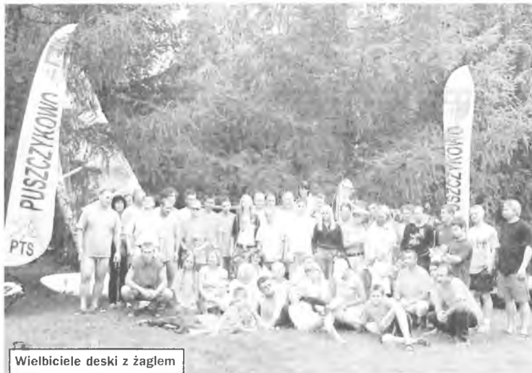
Wielbiciele deski z żaglem