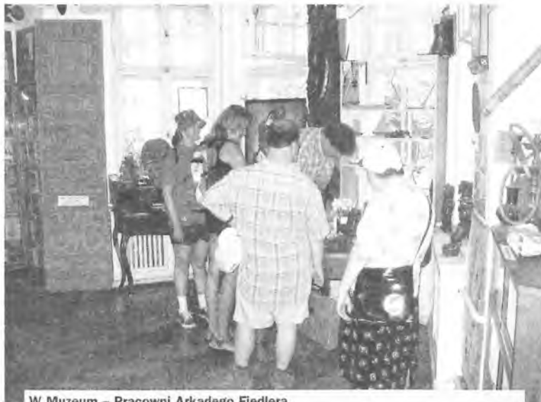
W Muzeum – Pracowni Arkadego Fiedlera

D om Pomocy Maltańskiej w Puszczykowie 1 lipca obchodził 5. urodziny. Obyło się bez fety, gdyż już wcześniej postanowiliśmy, że urodziny będziemy obchodzić specyficznie - pracowicie i przez cały rok. 21 maja w Mosińskim Ośrodku Kultury otworzyliśmy naszą wystawę „Władca Pierścieni”. Od 4 do 18 czerwca poprawialiśmy kondycję psychofizyczną na turnusie rehabilitacyjnym w Węgierskiej Górze k/Żyweca. Wreszcie 11 lipca odbył się zorganizowany przez nas „Rajd Puszczyka”. Oto wrażeniami z tych dwóch ostatnich wydarzeń.