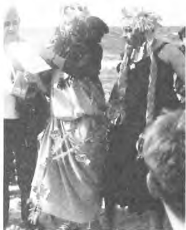
Chrzest na plaży