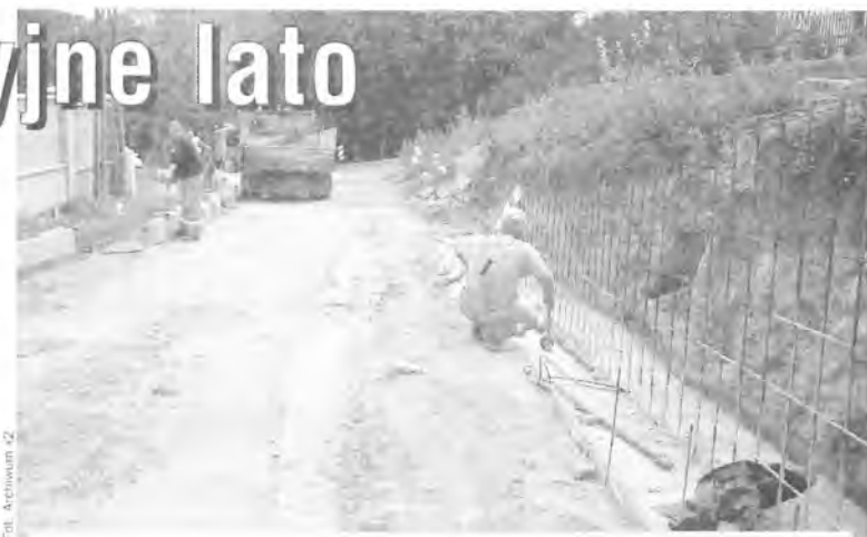
Budowa muru oporowego

było późniejszym niż zakładano opuszczeniem terenu drogi przez niektórych mieszkańców. Z kolei na koniec sierpnia zaplanowano odbiór prac budowy kanalizacji sanitarnej w ulicach Chabrowej i Krótkiej oraz przy ul. Zalesie i Zapłaty, gdzie konieczne było wykonanie dwóch przecisków pod szosą