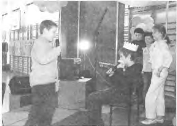
Młodzi aktorzy w spektaklu pt. „Szopka z przeszkodami”

Gościliśmy także trzy zespoły taneczne. Na parkiecie królowały tańce latynoamerykańskie, walc i tango. Najmłodsze dziewczynki z zachwytem patrzyły na mieniące się stroje tańczących dziewczyn.