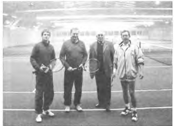
Właściciel obiektu z organizatorami turnieju