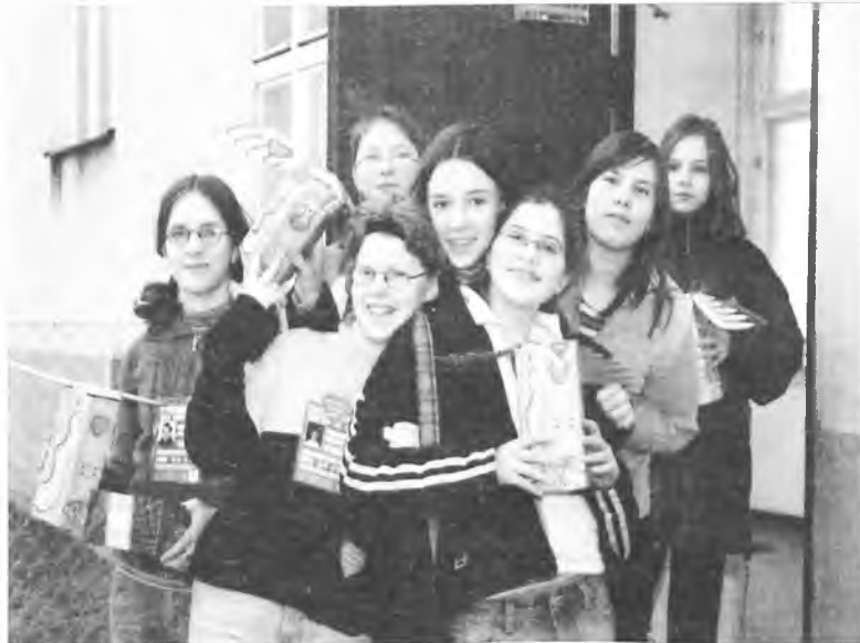
XIII Finał Wielkiej Orkiestry Świątecznej Pomocy - czytaj str. 2-4