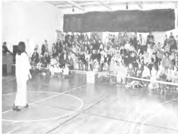
Aukcja na rzecz WOŚP

Od początku istnienia, tj. od 12 lat, Fundacja zebrała 53.616.501 USD, za które zakupiono 16 000 urządzeń ratujących i leczących życie dzieci. W tym roku kwestowało blisko 120 000 wolontariuszy, którzy zorganizowani byli w 1200 sztabach w Polsce i za granicą.