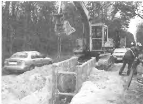
Prace na ul. Wczasowej