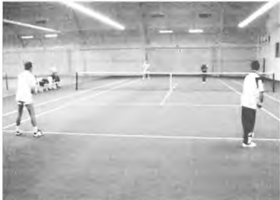
Turniej deblowy w nowej hali ośrodka ANGIE

Tomasz Wapniarski i Ryszard Pietrzak należą do czołówki w omawianym cyklu. Ryszard – świetny deblista – jest też doskonałym organizatorem turnieju. Ryszard – świetny deblista – jest też doskonałym organizatorem turnieju.