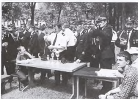
Strzelanie z wiatróvky na Zielonym Rynku