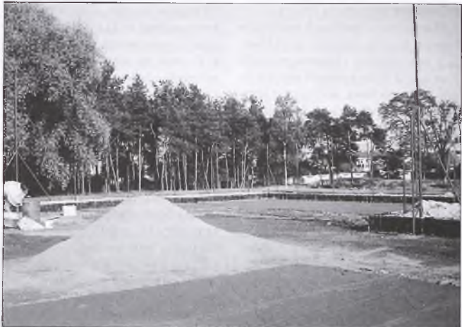
Już za chwilę na nowomiejskich obiektach sportowych pojawią się pierwsi gracze

Ramowy program imprezy: * oficjalne otwarcie Ośrodka Sporto- wo-Rekreacyjnego * pokazowy mecz w tenisa ziemnego * mecz pomiędzy drużynami „Riwal”-Nowe Miasto a TEAM KÓRNIK (rewanż za finał Średzkiej Amatorskiej Ligi Koszykówki) * półfinały i finał turnieju tenisowego * inne atrakcje Imprezę od strony artystycznej uświetni chór Domino Cantemus oraz Dziecięcy Zespół Folkloro- styczny. Dokładny program ukaże się na plakatach.