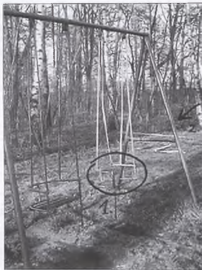
Plac zabaw w Boguszynie. 1. Huśtawka bez siedziska; 2. Przewrócony „klucz wiolnowy” do wspinania się.