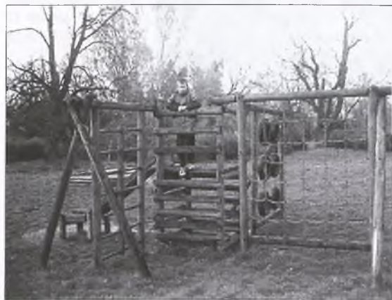
Plac zabaw przed pałacem w Klęce. Drabinki, łańcuchy do wspinania się, zjeżdżania. Miejsce zabaw solidne i bezpieczne.

szkoly w Kolniczkach - tam karuzela zamiast czterech, ma tylko trzy