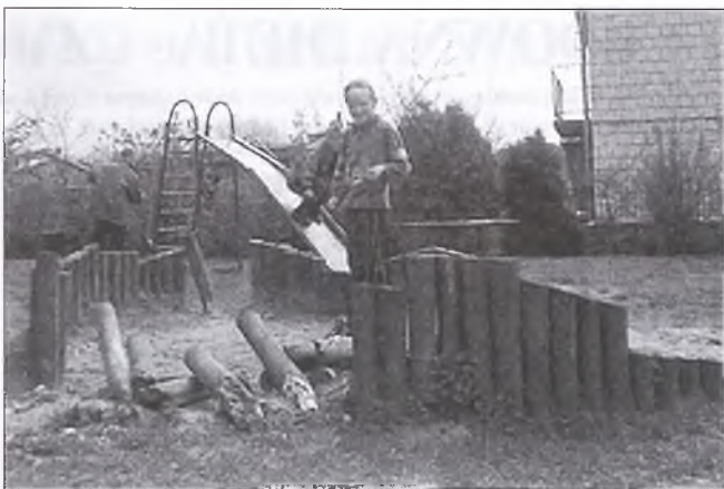
Plac zabaw na „działkach” w Nowym Mieście. Piaskownica prawie bez piasku, zniszczone ogrodzenie.

Na niemal każdym placu zabaw jest piaskownica i z niemal każdą ten sam kłopot: oprócz dzieci mają do nich dostęp także psy i koty, które bynajmniej nie zachodzą tam, by się pobawić. Czystej, zamykanej lub dobrze ogrodzonej piaskownicy nie uświadczy się na żadnym placu zabaw w gminie Nowe Miasto.