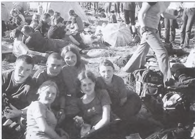
Tysiące młodych ludzi przez cały dzień oczekiwały oczekiwali na wieczorne nabożeństwo

Tak, jak na każdym weselu, nie zabrakło muzyki i tańców przy dźwiękach pieśni lednickich. Znalazł się również