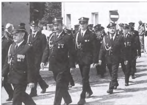
Uroczysty przemarsz strażaków spod kościoła na Zielony Rynek