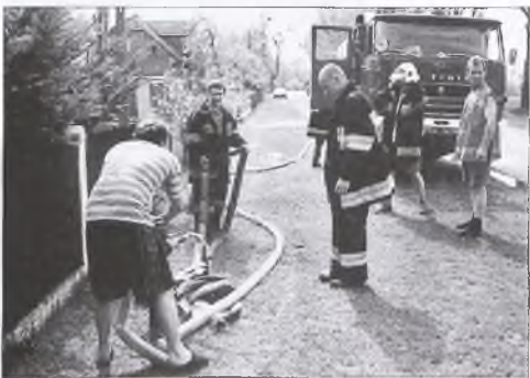
Strażacy przy pracy - pompowanie wody po gaszeniu pożaru w lesie między Chociczą a Roguskiem

cy wzięli udział w konkursie strzelania z wiatróvky.