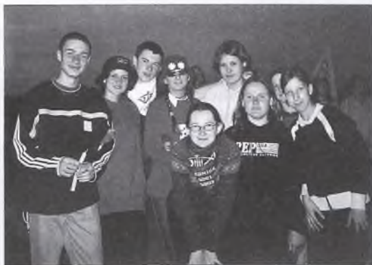
Mimo zmęczenia i chłodu humory dopisywały

dźwiękach muzyki, z pieśnią na ustach tysiące ludzi, mimo zmęczenia szło w symbolicznym korowodzie przez bramę III tysiąclecia. Lednickie spotkania świadczą o tym, że młodzi ludzie potrafią zjednoczyć się i wspólnie chwalić Boga. Nie przeszkadza w tym chłód i zmęczenie. Liczy się to, że przeżywamy razem, że to, co robimy ma sens.