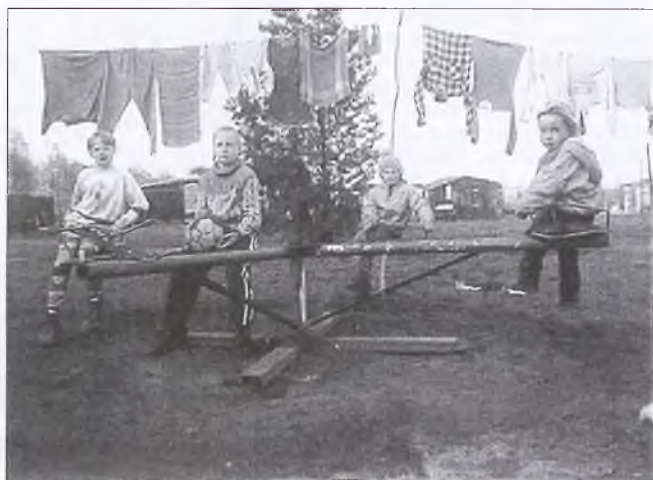
Aleksandrów. Stąd plac zabaw „zniknął” dziesięć lat temu. O karuzelę postarali się rodzice.

Niestety im mniejsze miejscowości, tym smutniejsze place zabaw. Rzadko która z huśtawek w Bogu-