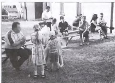
Obchody Dnia Strażaka w Wolicy Koziej