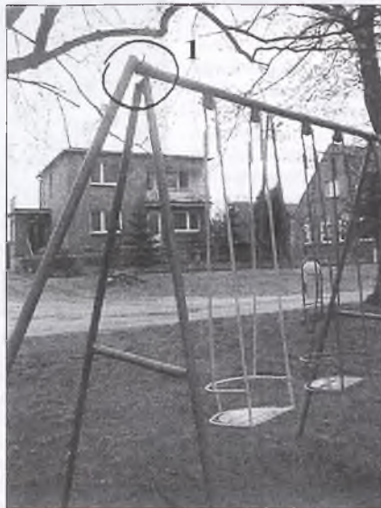
Plac zabaw na „Zdrojach” w Nowym Mieście. 1. Uszkodzona konstrukcja huśtawki.