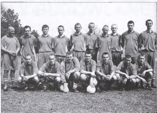
Wielkopolska Korporacja Nowe Miasto

jest amatorska, a więc hobbyistyczna - przynajmniej powinna. Szkoda, że niektóre osoby próbują dorobić jej kilka kolorowych naszywek. Pomysł jej stworzenia był trafiony w dziesiątkę. Relaks na świeżym powietrzu, trochę adrenaliny i czysta gra.