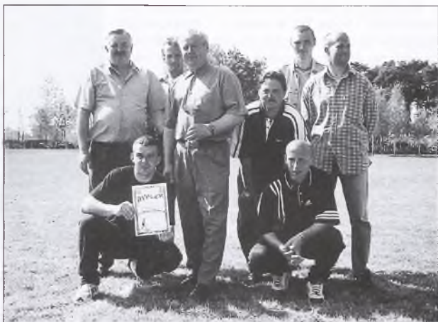
Liderzy drużyny samorządowców z Nowego Miasta