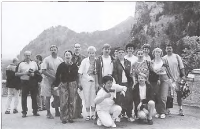
Pracownicy Phytopharmu w Alpach Bawarskich

Ciekawą osobliwością jest zbiór różnych dziwnych przedmiotów pochodzących z całego świata jakie znajdowano w zakupywanych surowcach od ręcznie robionych afrykańskich naszyjników po starą, zardzewiała kulę armatnią. Sortowanie i oczyszczanie surowców we wstępnej fazie produkcji pozwala właśnie odkryć takie „skarby” i zapobiec uszkodzeniom urządzeń. Wędrując po firmie kilka godzin mieliśmy okazję prześledzić kolejne fazy obróbki surowca