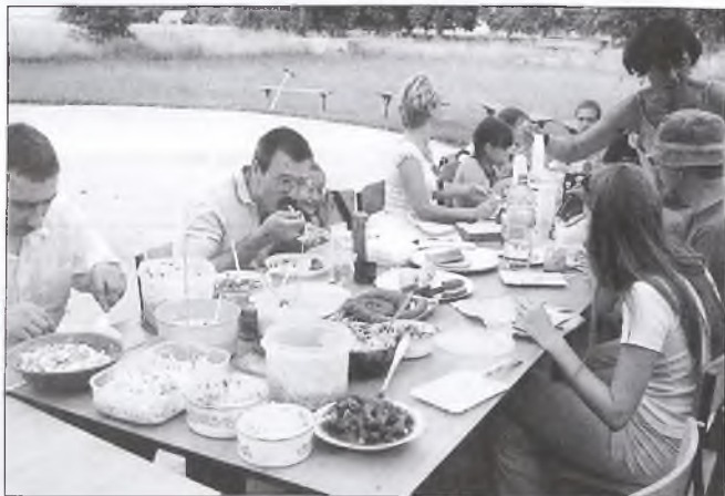
„Jakie to zdrowe i smaczne!”

Po krótkim odpoczynku panie zaczęły wymawiać z toreb pojemniki z przy- gotowanymi przez siebie surówkami, sa- łatkami, soki i różne napoje bezalkoho- lowe. Kiedy to wszystko pojawiło się na stolach, trudno było się oprzeć, aby nie sięgnąć po talerz i nie nałożyć sobie choć odrobinę każdej z tych pyszności. Była to prawdziwa uczta zarówno dla oczu jak i podniebienia. Bo jakże mo-