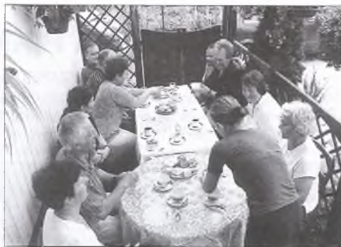
Gościnne przyjęcie u państwa Kmieciaków w Chociczy