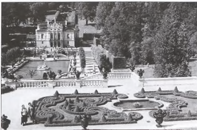
Spacer w ogrodach pałacowych

Nagrody do odbioru w sklepie B. Wilczyńskiej, Nowe Miasto, ul. Poznańska nr 12.