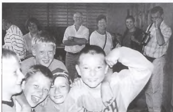
Spotkanie z półkolonistami w Chociczy

26 sierpnia na Osiedlu 40-lecia w Chociczy odbędzie się festyn sportowo-rekreacyjny: