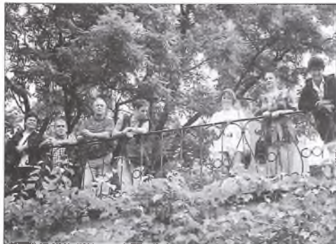
Na tarasie pałacyku myśliwskiego w Miłostawiu