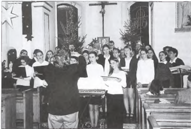
Chór „Domino Cantemus” z koncertem w klasztorze Sióstr Służebniczek Niepokalanego Poczęcia NMP w Pleszewie.