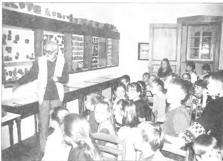
Uczniowie SP w Kolniczkach na lekcji muzealnej w jarocińskim muzeum

Pierwsze drewniane siedziby właścicieli Nowego Miasta i Jarocina spłonęły prawie równocześnie, pod koniec XIV w. Na ich miejscu wzniesiono póź-