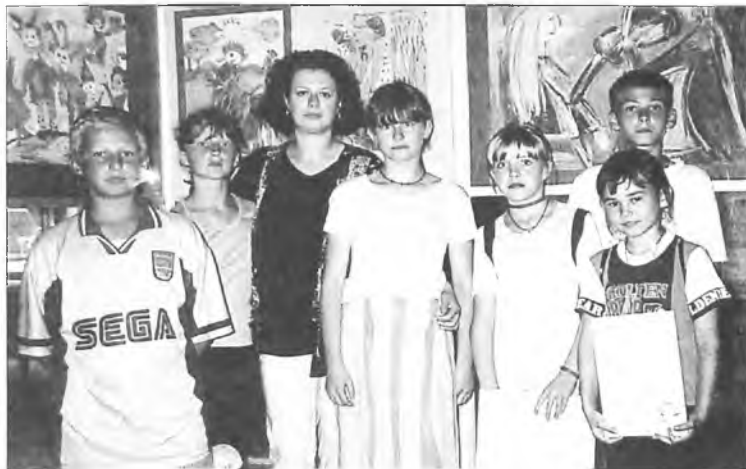
Dzieci z Klęki wraz ze swoją opiekunką na wystawie w Poznaniu