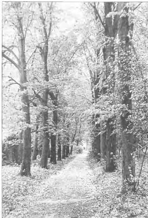
Cienista aleja lipowa posadzona w latach trzydziestych

O parku pałacowym w Klęce można by pisać jeszcze wiele tym bardziej, że jest on dość dobrze utrzymany. Najle-