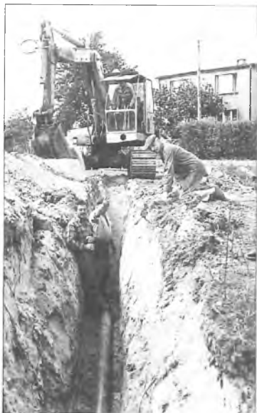
Budowa wodociągu w Chwałęcinie w roku 1992

Współpraca z gminą Vestenbergsgreuth w Bawarii rozpoczęła się w 1994 r. Kontakty te zostały utrwalone podpisaniem w 1995 r. umowy o współpracy. Znaczący był udział gminy niemieckiej przy budowie szkoły w Klęce. Jej wyrazem jest m.in. wakacyjna wymiana grup młodzieżowych.