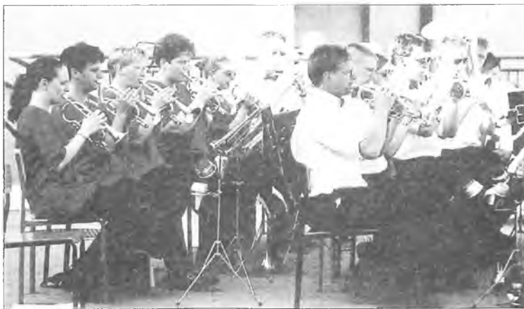
Gościmy koncert orkiestry holedenerskiej dla samorządowców