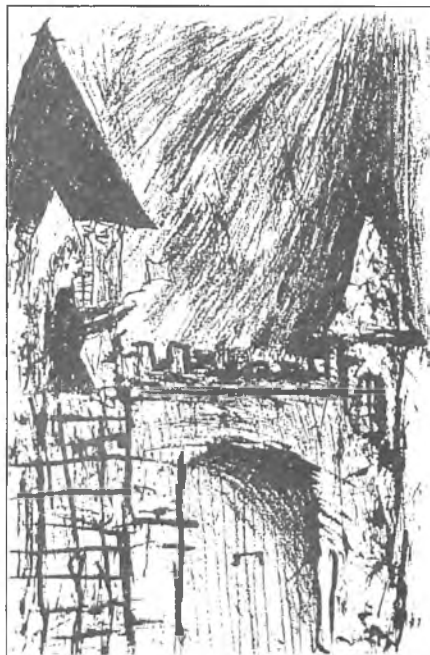
rys. Marta Szymkowiak