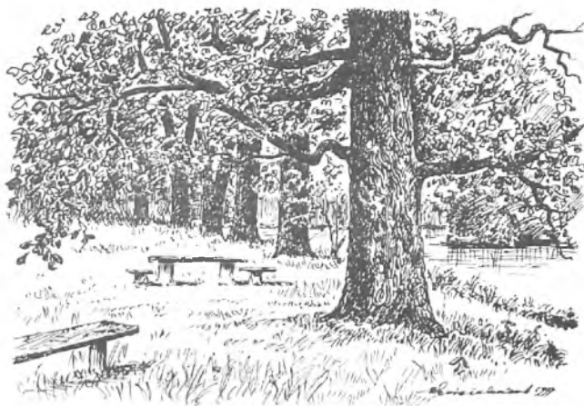
Dęby nad Starą Wartą niedaleko Nowego Miasta