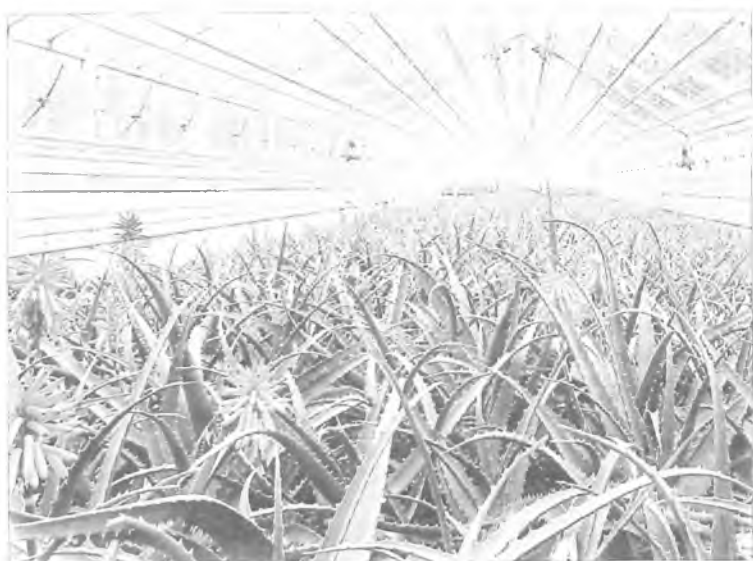
Szklarniana uprawa aloesu