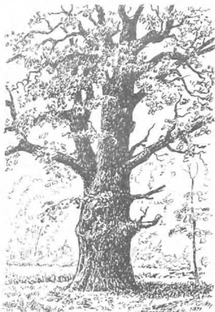
Stary dąb przy drodze do Dębna