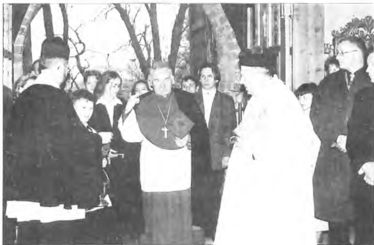
fol. Z. Tokarski

Ks. Biskup: Muszę zdradzić, że to ja zaproponowałem Ks. Proboszczowi termin wizyty w Waszej parafii. Wybrałem go, bo pamiętałem o kaplicy Miłosierdzia Bożego w Chociczy i tu