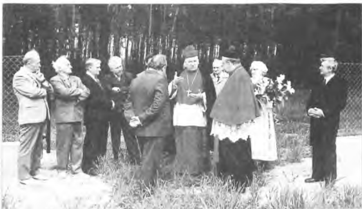
fol. B. Pawlak