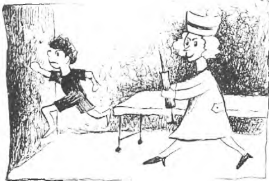
rys. E. Lewandowska

Tulaza ma pod swoją opieką szkołę w Chociczy. Higienistki są w każdej „swojej” szkole 2 razy w tygodniu. Ich głównym zadaniem jest oświata zdrowotna i profilaktyka. Sprawdzają czystość, przygotowują dzieci do bilansów zdrowia (badanie wzroku, słuchu, wagi, wzrostu, postawy), które wykonuje już lekarz w szkole (jeśli jest w niej ga-