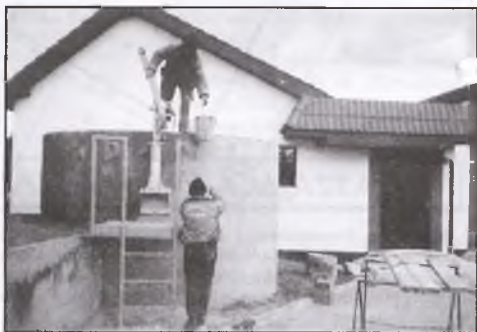
Budynek zagęszczania osadu

Dokumentacja oraz instrukcja obsługi stanowi integralną część budowy.