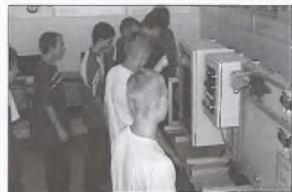
Skrzynka mechatroniczna do nauki zawodu monter mechatronik

Dzięki odpowiedzi na rzeczywiste zapotrzebowanie rynku pracy i kształceniu w tych zawodach, w których poszukiwani są specjaliści, istnieje duża szansa, że po zakończeniu edukacji młodzież z łatwością znajdzie zatrudnienie. Zapraszamy do naszyc placówek. ■ Karolina Korcz, Gabinet Starosty