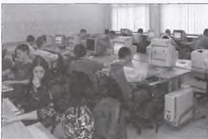
Nowoczesna pracownia komputerowa w Zespole Szkół nr 1 w Swarzędzu

Od wielu lat stan polskiej oświaty jest przedmiotem debaty publicznej. Wielokrotnie, z różnym skutkiem, podejmowano próby zmiany tendencji niekorzystnych dla uczniów i nauczycieli, a w dalszej perspektywie – dla całego społeczeństwa. Próby te odbijają się szerokim społecznym echem, szczególnie w przypadku działań podejmowanych przez Ministerstwo Edukacji Narodowej, tymczasem również na poziomie lokalnym można skutecznie i efektywnie przekształcać polską szkołę. Przykładem mogą być tu placówki oświatowe zarządzane przez powiat poznański.