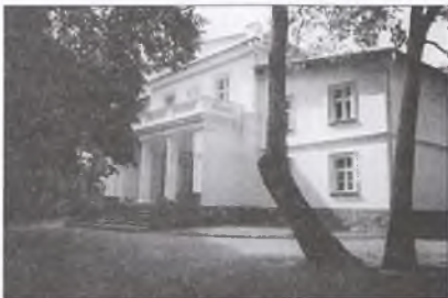
Budynek Zespołu Szkół w Rokietnicy