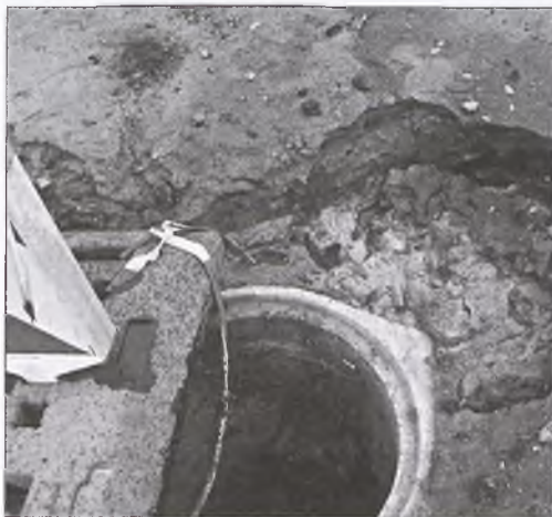
Skutki ulewy na ul. Poznańskiej

Należy zauważyć, że tak obfite opady są przypadkiem bardzo rzadkim, ich intensywność wiąże się z nieuchronnym wystąpieniem trudności w odprowadzaniu wody. Żadne ze stosowanych rozwiązań technicznych nie jest w stanie zapewnić bieżącego odbioru takiej ilości wody. W ten sam weekend w Poznaniu ulewa dokonała również bardzo dużych zniszczeń wraz z podtopieniem głównego dworca kolejowego. Pracownicy Urzędu Miejskiego na bieżąco monitorują zagrożenia związane z nagłymi załamaniem pogody i w możliwie najkrótszym czasie uruchamiają