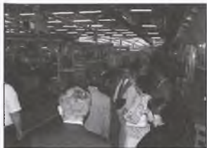
Wizyta w zakładach SKF w Poznaniu