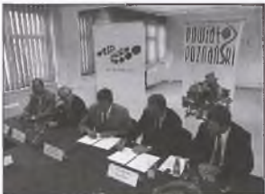
Uroczyste podpisanie porozumienia

Od kilku lat szkoły ponadgimnazjalne powiatu poznańskiego kształcą młodzież w zawodach poszukiwanych przez wielkopolskich pracodawców. Florysta i mechatronik to tylko dwa z najbardziej znanych przykładów. Teraz do tej listy dołączy jeszcze jeden zawód – operator obrabiarek skrawających. W odpowiedzi na zapotrzebowanie koncernu SKF, największego na świecie dostawcy produktów, rozwiązań oraz usług w przemyśle łożyskowym, uszczelnieniowym oraz przemysłach związanych z ruchem obrotowym, który w Poznaniu działa na bazie dawnej Fabryki Łożysk Toczných, w roku szkolnym 2007/2008, w ZS nr 1 w Swarzędzu, powiat poznański uruchamia kształcenie przyszłych szlifierzy metali i tokarzy. Nauka przedmiotów ogólnokształcących oraz teoretycznych zawodowych odbywać się będzie w Swarzędzu, a zajęcia praktyczne w fabryce SKF Poznań oraz Poznańskim Centrum Kształcenia Ustawicznego i Praktycznego.