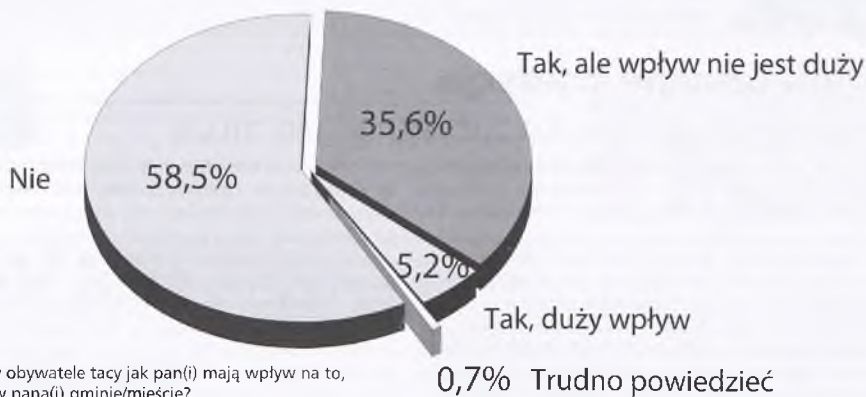
Wykres 1: Czy obywatele tacy jak pan(i) mają wpływ na to, co się dzieje w pana(i) gminie/mieście?

projekt nowelizacji ustawy o pracownikach samorządowych – który w najbliższym czasie trafić ma do Komisji Wspólnej Rządu i Samorządu – zawierać ma m.in. przepisy, które pomogą władzom samorządowym w pozyskiwaniu i utrzymaniu w urzędach jak najlepszych pracowników. Obecnie władze samorządowe często tracą doświadczonych pracowników na rzecz firm komercyjnych, gdyż uchwalone 18 lat temu przepisy nie przewidywały sytuacji konkurencji na rynku pracowników. Nowa ustawa uelastyczni możliwości, jakimi samorządy dysponują w zakresie rekrutacji, oceny pracowników, wprowadzenia lepszego systemu motywacyjnego i stworzenia ścieżek kariery. Następnie profesor Marek Ziółkowski podzielił się z zebranymi „Socjologiczną i polityczną refleksją nad stanem samorządów lokalnych”. Przytaczał między innymi wyniki badań CBOS-u, z których wynika, że Polacy znacznie lepiej oceniają sytuację i możliwości rozwoju w miejscu swojego zamieszkania, niż w kraju. Jednocześnie unaocznili, że po prawie 20 latach funkcjonowania demokracji lokalnej obywatele w dalszym ciągu nie mają poczucia wpływu na to co się dzieje w ich gminie (wykres 1).