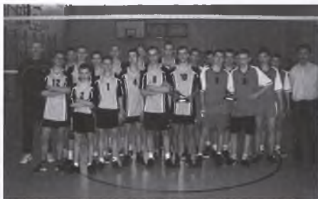
Drużyna chłopców z Gimnazjum nr 2