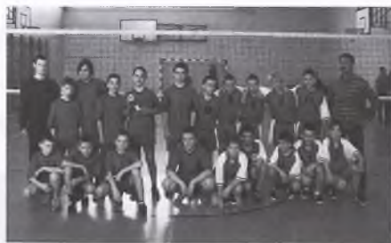
Drużyna chłopców ze Szkoły Podstawowej nr 1