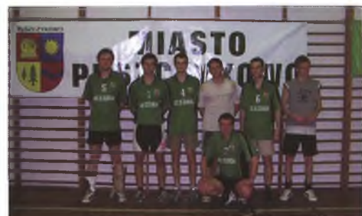
PLPS zdobywcy III miejsca zespół Zubrów