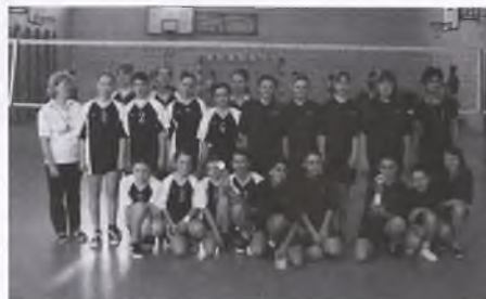
Drużyna dziewcząt ze Szkoły Podstawowej nr 2