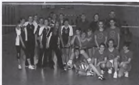
Drużyna dziewcząt z Gimnazjum nr 2