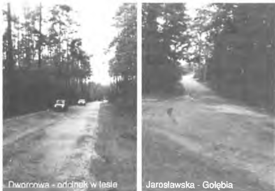
Dworcowa - odcinek w lesie