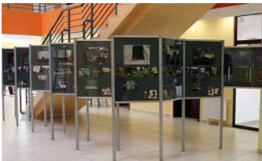
18-19.04.2009 Władysławów Gminny Ośrodek Kultury XXI Wielkopolskie Porównania Filmowe – prezentacja wystawy „Bujanie w obłokach”