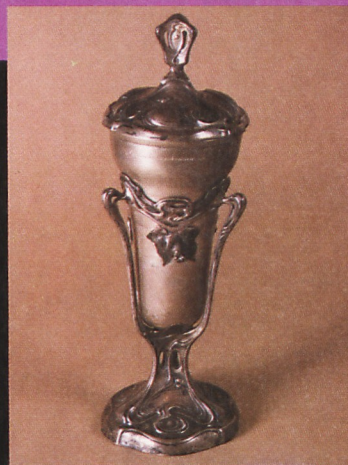
Puchar secesyjny - nagroda przechodnia Towarzystwa Gimnastycznego „Sokół” w Stęszewie (1903)