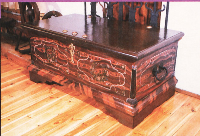
Skrzynia posażna z Żuław