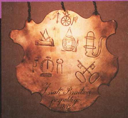
Cecha (tzw. obeszanie) stęszewskiego cechu „pospolitego” (1845)