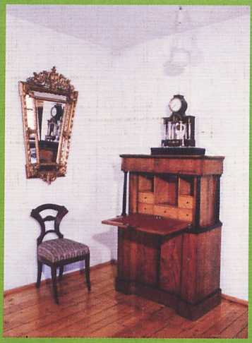
Ekspozycja wnętrza domu mieszczańskiego (1 poł. XIX w.)