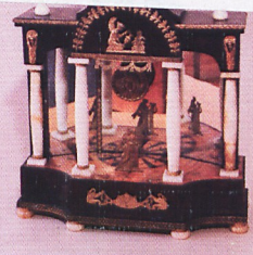
Empirowy zegar kominkowy (pocz. XIX w.)