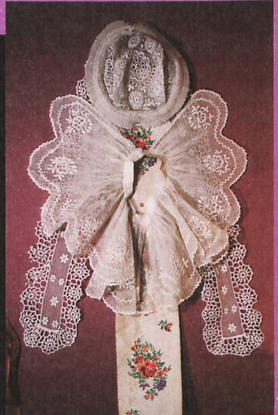
Czepek tiulowy z kryzykiem, „bandkami” i haftowana wstążka