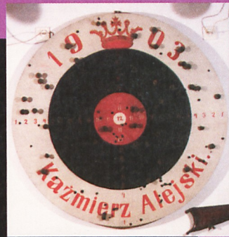
Tarcza strzelecka bractwa kurkowego (1903)