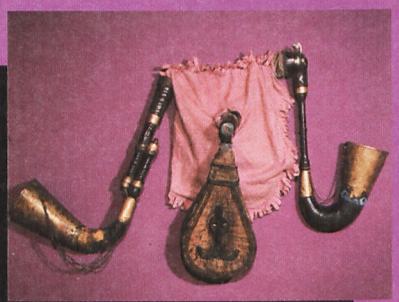
Dudy z okolic Stęszewa