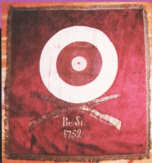
Sztandar stęszewskiego bractwa kurkowego (1752)