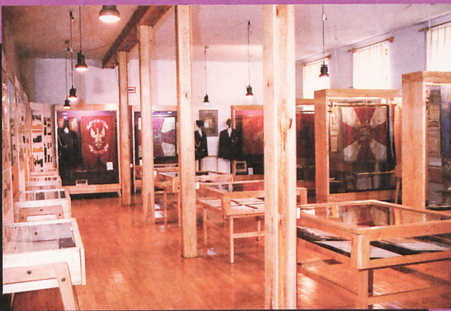
Sala ekspozycji historycznej