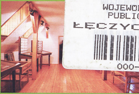
Sala wystaw czasowych

WOJEWODZKA BIBLIOTEKA PUBLICZNA W POZNANIU ŁĘCZYCA — 104825