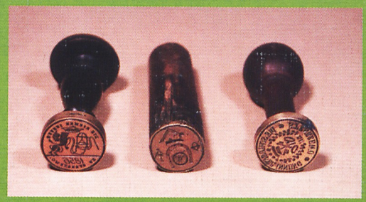
Tłoki pieczętnie stęszewskich cechów rzemieślniczych (1 poł. XIX w.)