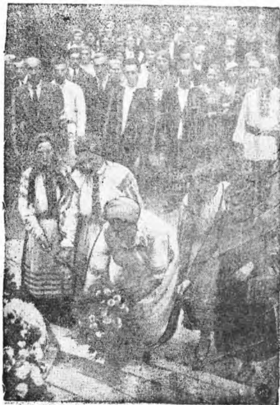
POLESZCZYCY W WARSZAWIE.

Do stolicy przybyła wycieczka regionalna z ziemi poleskiej w liczbie kilkuset osób, przeważnie młodzieży w barwnych strojach ludowych. Na zdjęciu moment składania przez poleszczyków hołdu pamięci Marszałka Józefa Piłsudskiego w Belwedrze.