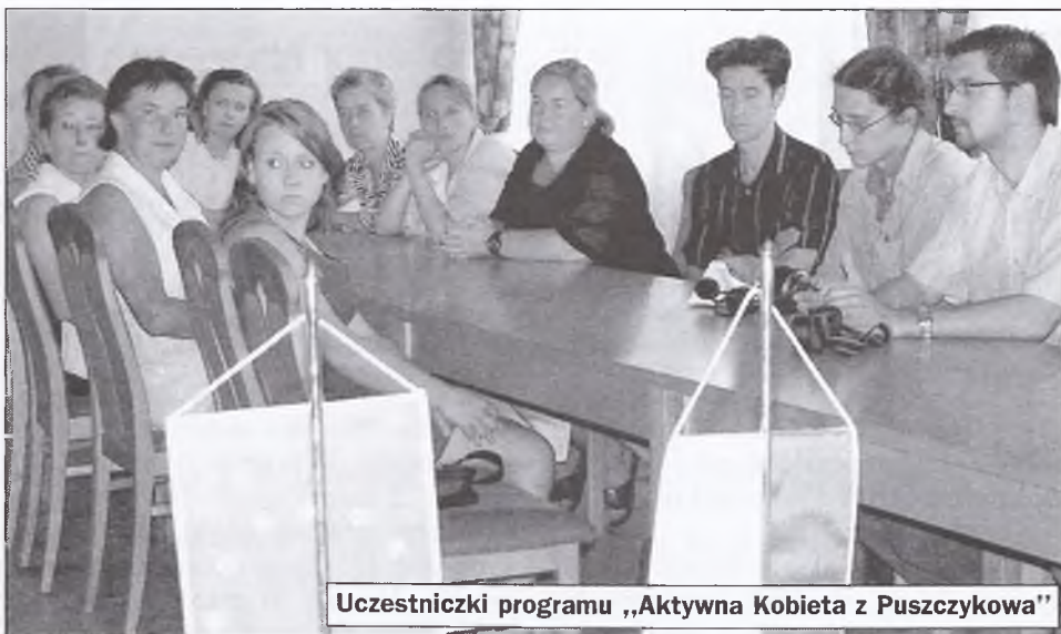
Uczestniczki programu „Aktywna Kobieta z Puszczykowa”

Ostatnie dni przyniosły bardzo dobrą wiadomość. Puszczykowo otrzymało dofinansowanie ze środków Europejskiego Funduszu Rozwoju Regionalnego w ramach „Zintegrowanego Operacyjnego Rozwoju Regionalnego 2004-2006” projektu „Modernizacja ulicy Poznańskiej”. W 2007 r. ekipy budowlane zbudują na części ulicy kanalizację deszczową. Cała Poznańska zyska nową nawierzchnię jezdni, chodniki, ścieżkę rowerową i miejsca parkingowe. W miejsce obecnego skrzyżowania ulicy Poznańskiej z Kościelną i Posadzkiego powstanie rondo. Red