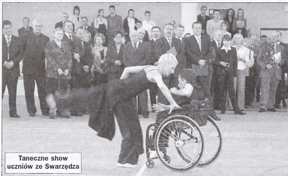
Taneczne show uczniów ze Swarzędza

Budowa szkoły w Swarzędzu należała do największych przedsięwzięć