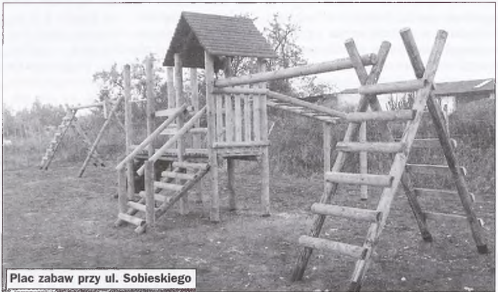
Plac zabaw przy ul. Sobieskiego