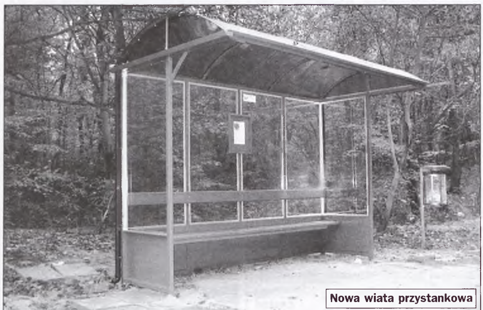
Nowa wiata przystankowa