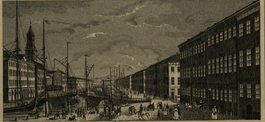
FRÅN LILLA TORGET.

Ritadt efter naturen af Leonard Björkfeldt.