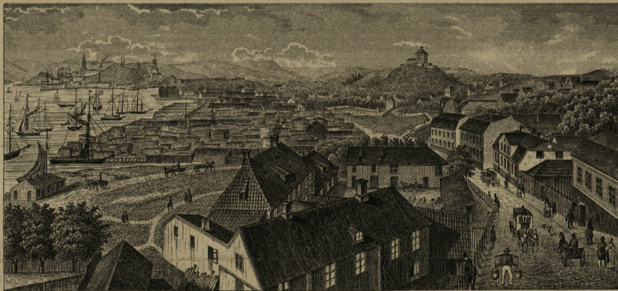
GÖTHEBORG, FRÅN MASTHUGGET.