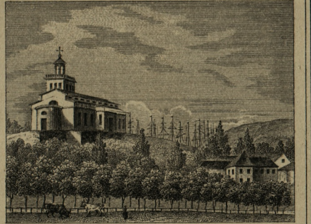
CARL JOHANS KYRKA.