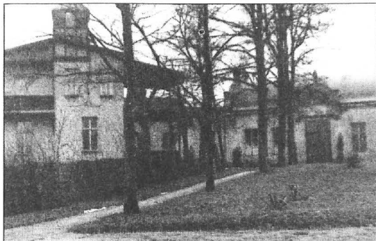
Przedwojenny dom Braci Serca Jezusowego

Również w Puszczykowie, gdzie zaplanowano przeprowadzenie prac odwadniających miejscowość, utworzony został w ostatnich miesiącach 1941 roku obóz dla Żydów. Na miejsce obozu wyznaczono położoną w Starym Puszczykowie posesję należącą do Braci Serca Jezusowego, skąd uprzednio wysiedlono wszystkich zakonników. Obóz mieścił się w kilkumorgowym parku-ogrodzie otaczającym dwupiętrowy dom z około 20 pomieszczeniami oraz budynek gospodarczy.