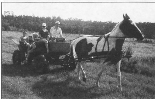
Wojciech Kociemba - niestrudzony Przyjaciel dzieci

Zabawy i gry - jak zawsze w Dzień Dziecka - pomysłowe, atrakcyjne i ciekawe. Ćwiczyły i sprawność, i refleks, i spostrzegawczość, a przede wszystkim uczyły uczciwości w grach konkurencyjnych i solidarności we współzawodnictwie.