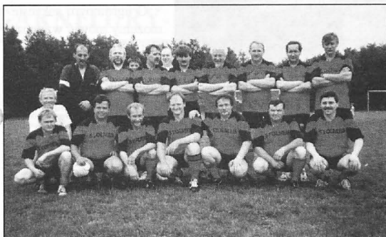
Zwarta Drużyna Powiatu

Wojewódzka Biblioteka Publiczna w Poznaniu ogłasza konkurs plastyczny dla dzieci i młodzieży