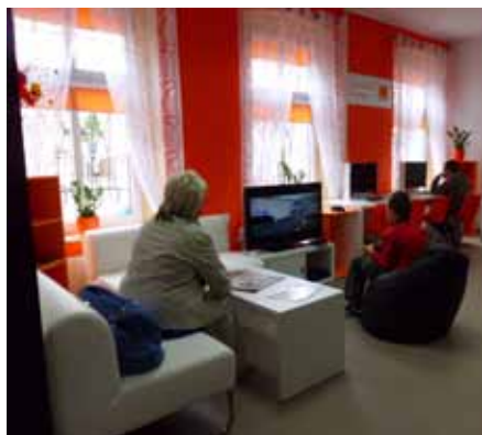
„Pracownia Orange”, która powstała we współpracy z Fundacją Orange

25 czerwca br. miało miejsce uroczyste otwarcie biblioteki w Pobiedziskach. W zażytkowym budynku przy ul. Kostrzyńskiej 21, po gruntownym remoncie oraz wyposażeniu biblioteki w nowe meble udostępniamy czytelnikom zbiory.