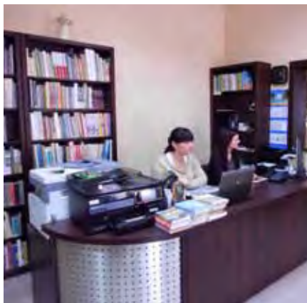
Nowe wnętrza pobiedziskiej biblioteki

Pobiedziska biblioteka zaprasza do korzystania z pozyskanej w konkursie „Pracowni Orange”. Do projektu Fundacji Orange aplikowało 571 instytucji z kraju, pobiedziska księżnica znalazła się w gronie 50 placówek, które Fundacja wyposażyła w trzy nowoczesne sta-