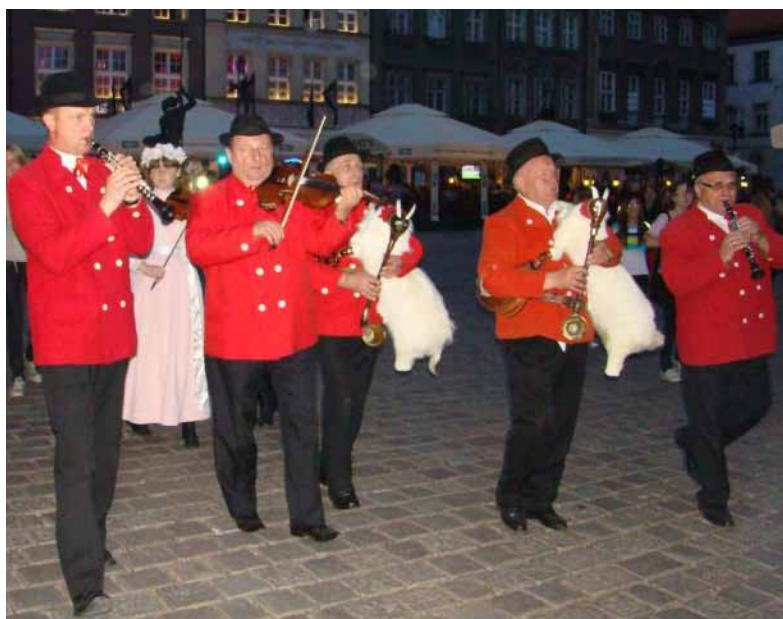
Kapele kozła białego ze Zbąszynia i Przyprostyni

(okolice Krobii) oraz z okolic Dąbrówki Wielkopolskiej i Podmokli.