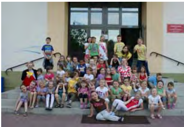
Dzieci biorące udział w turnieju

W piątek 11 maja zakończył się Ogólnopolski Tydzień Bibliotek. Nawiązując do tegorocznego hasła zorganizowano dla dzieci Noc w Bibliotece.