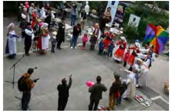
...Zespół Folklorystyczny „Wielkopole” poprowadził warsztaty tańca ludowego.