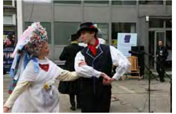
...prezentacja strojów Bambrów Poznańskich...