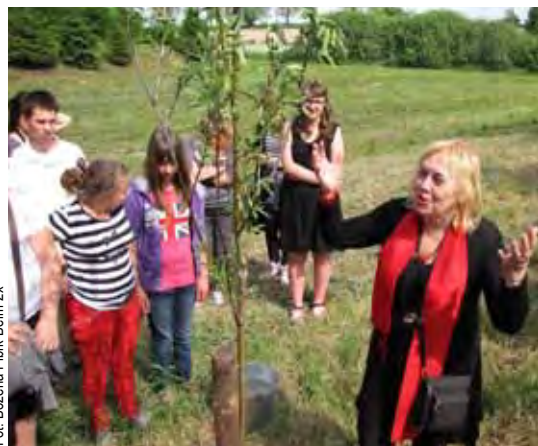
Sadzenie wierzby w „Gaju Poezji”