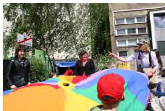
...zabawy z chustą Klanza...