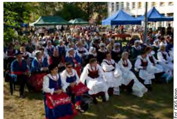
Uczestnicy Festiwalu Kultury Ludowej w Koninie