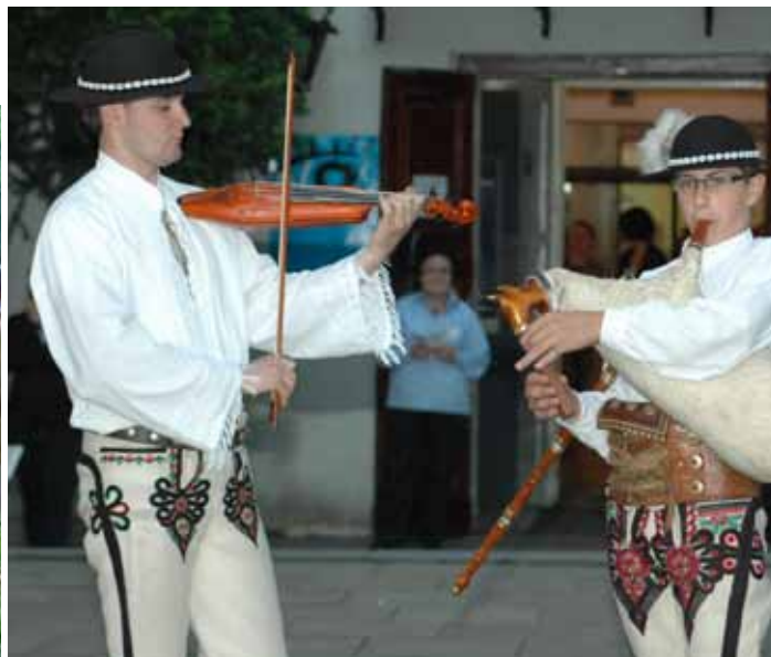
„Złóbcoki” i „Kozą” – kapela z Zakopanego

W sobotę odbył się na dziedzińcu Muzeum Etnograficznego pierwszy koncert oceniany przez jurorów (inaugurujący jednocześnie