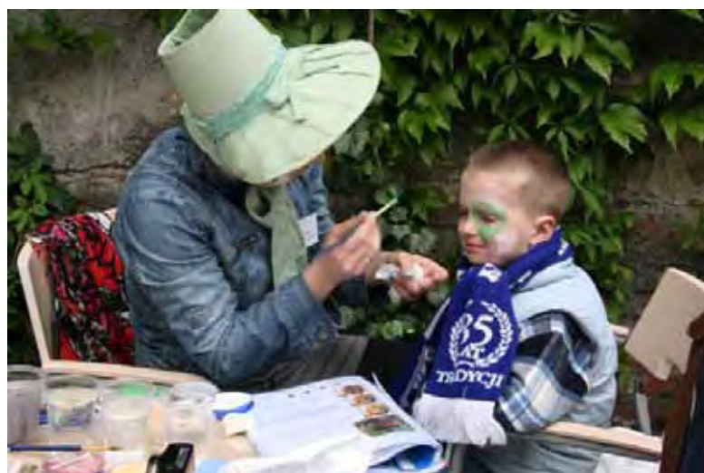
Nie zabrakło atrakcji dla najmłodszych... malowanie twarzy...