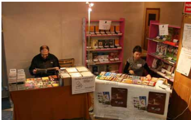
Można było kupić książki wydawane przez WBPiCAK i płyty ze sklepu muzycznego Dalga.