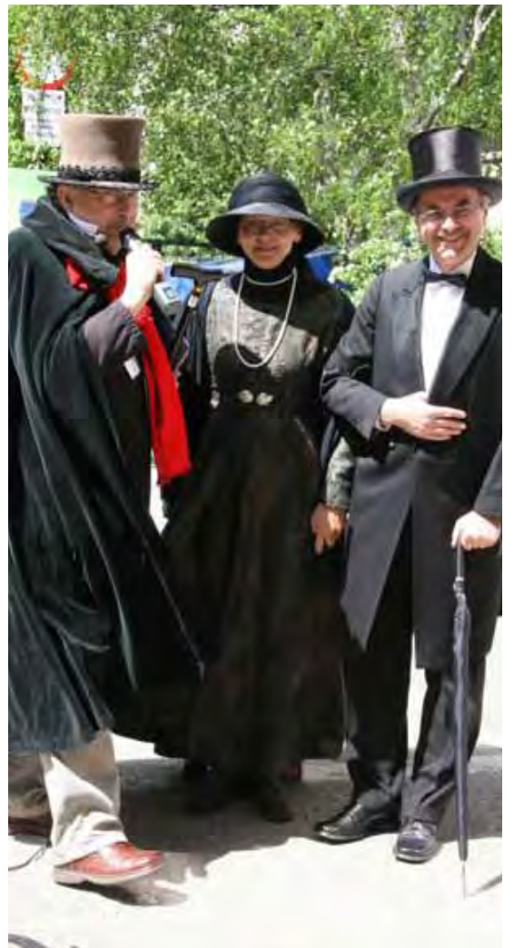
Państwo Laskowscy mieszkańcy ul. Prusa w okolicznościowych strojach.