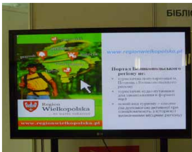
Prezentacja strony regionalnej WBPiCAK w Poznaniu

Nowością są trasy turystyczne zarejestrowane w formie plików dźwiękowych mp3 dające możliwość bezpłatnego pobrania przewodnika audio a także quizy, które w formie aktywnej zabawy prowadzą uczestników szlakiem zadań i zagadek. Portal dostępny jest w wersji anglo- i niemieckojęzycznej.