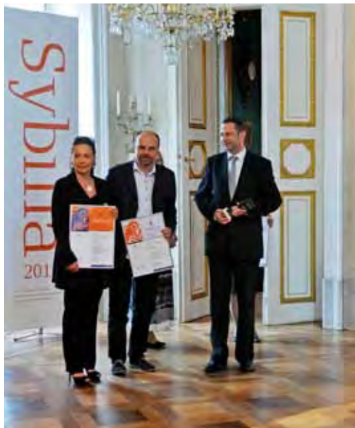
Pamiatkowe zdjęcie po wręczeniu nagrody