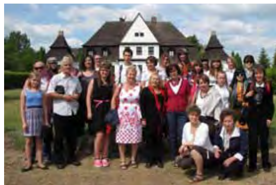
Uczestnicy XVI Lednickiej Wiosny Poetyckiej