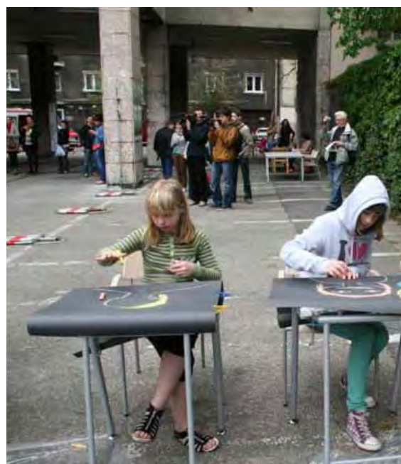
...konkurs plastyczny na najładniejszą lalkę...