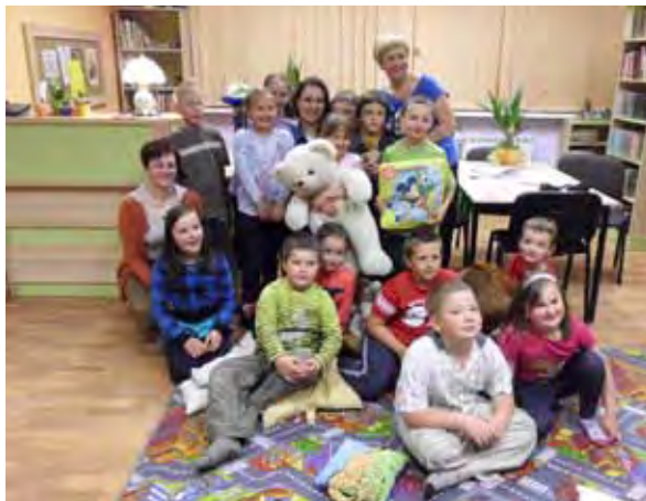
Uczestnicy baśniowej nocy