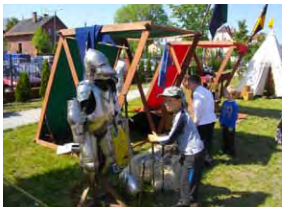
Fragment Wioski Dawnych Rzemieślników

Już po raz czwarty grodziska Biblioteka Publiczna zorganizowała „Majówkę z Książką”. Impreza odbyła się w sobotę 19 maja, tym razem na terenie za biblioteką przy ul. Kolejowej. Pogoda dopisała, publiczność również.