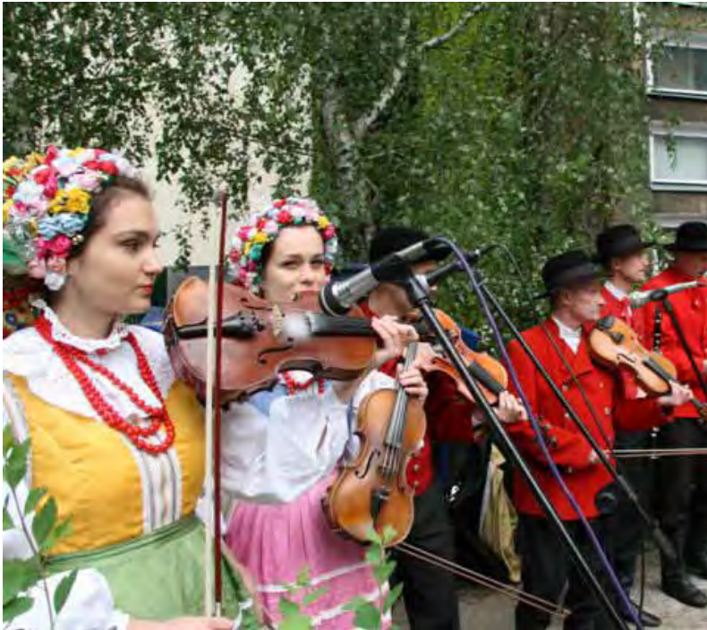
Były również akcenty ludowe...