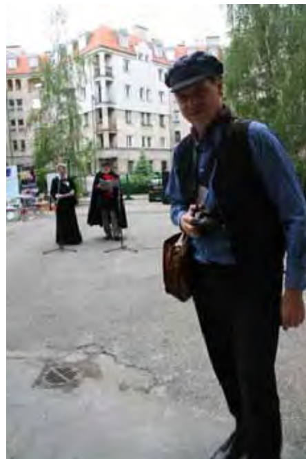
Biblioteczny gazeciarz rozdawał okolicznościową jednodniówkę.