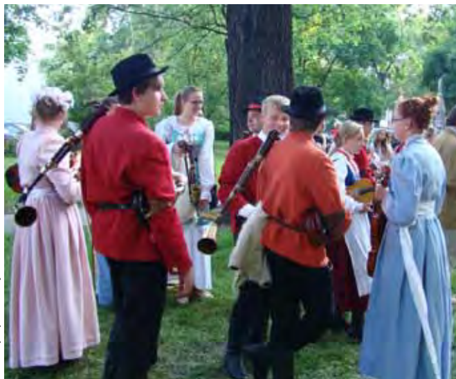
Kapele na dziedzińcu Muzeum Etnograficznego

W sobotę i niedzielę 19. i 20. maja odbyło się w Poznaniu coroczne spotkanie muzyków ludowych – Ogólnopolskie Konfrontacje Kapel Dudziarskich. Impreza tradycyjnie łączy w sobie prezentacje kapel dudziarskich, koźlarskich, warsztaty dla młodych muzyków oraz seminarium poświęcone ochronie ludowej muzyki i instrumentów charakterystycznych dla Wielkopolski.