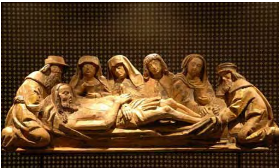
Jeden z obiektów „Złożenie do grobu” (pocz. XIV w.), za renowację którego doceniono Muzeum Początków Państwa Polskiego