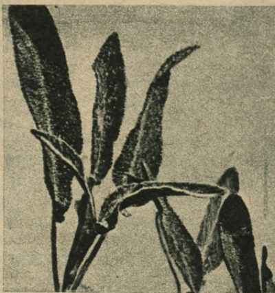
Szałwia ( Solvia officinalis )

się uprzykrzonym chwastem. Na 1 metr kw. potrzeba 1 g nasienia.