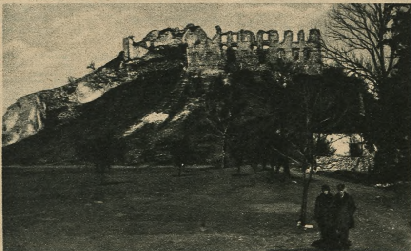
Ruiny zamku w Rabszynie (powiat olkuski)

Staraj się o miłość ubogich i nieszczęśliwych, bo ona obroni cię w dzień Sądu Bożego.