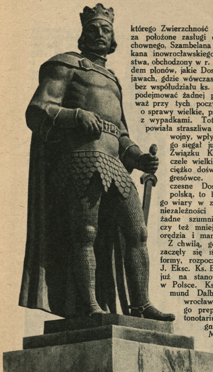
Pomnik twórcy potężnej Polski w jego dawnej stolicy.