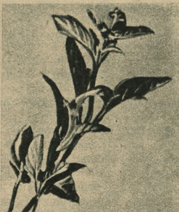
Bazylija ( Ocimum basilicum )

Kminek ( Carum Carvi ) lubi ziemię luźną, dobrze nawiezioną. W pierwszym roku po wysiewie wydaje roślina tylko listki przy- prawowe i korzenie używane jako jarzyna. Dopiero w drugim roku po wysiewie — w miesiącu lipcu, można zbierać nasiona.