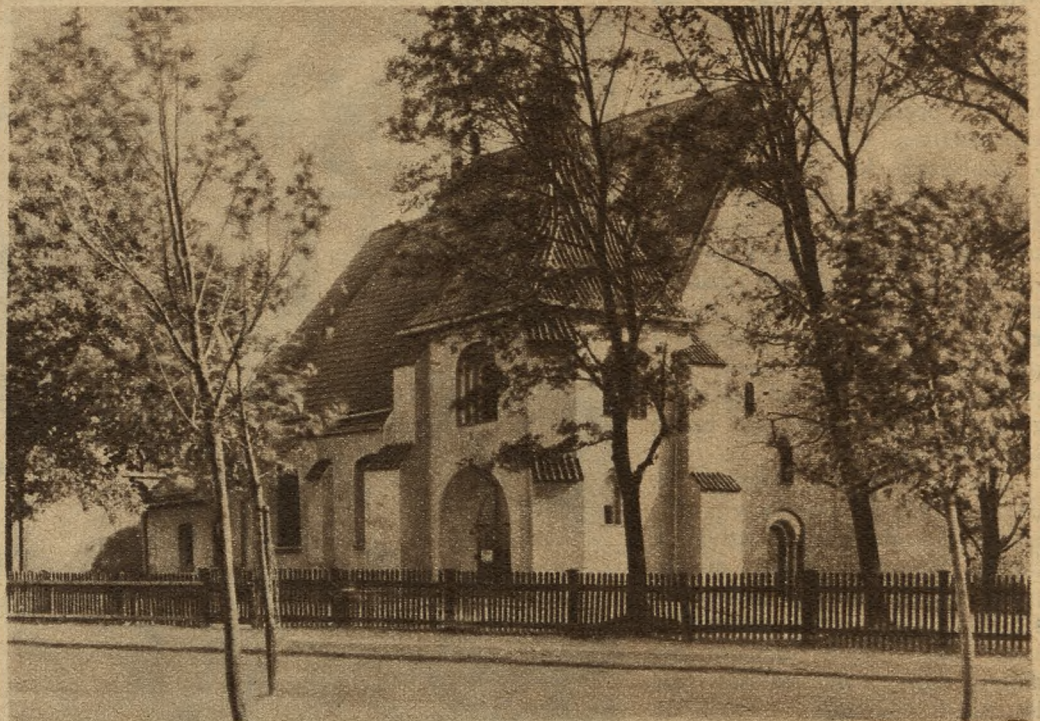
Kościół św. Jana w Poznaniu, zwany Komandorią jako dawny kościół Kawalerów Maltańskich.

Ale i z innego powodu czas już był najwyższy, aby powołano do steru nowych ludzi. Oto bowiem Polska zagrożona była z dwóch stron przez dwie wrogie potęgi, mianowicie rosyjski bolszewizm oraz hakatyzm niemiecki. Wróg bolszewicki palił i niszczył odwieczne polskie siedziby na Litwie i Rusi, Wilno już zagarnął i szedł na Kowno. Z drugiej strony wielka część dawnego zaboru pruskiego znalazła się, jak już pisałem, pod groźnym uciskiem rozmaitych grenzschutzów i heimatschutzów, które grabiły i paliły majątki