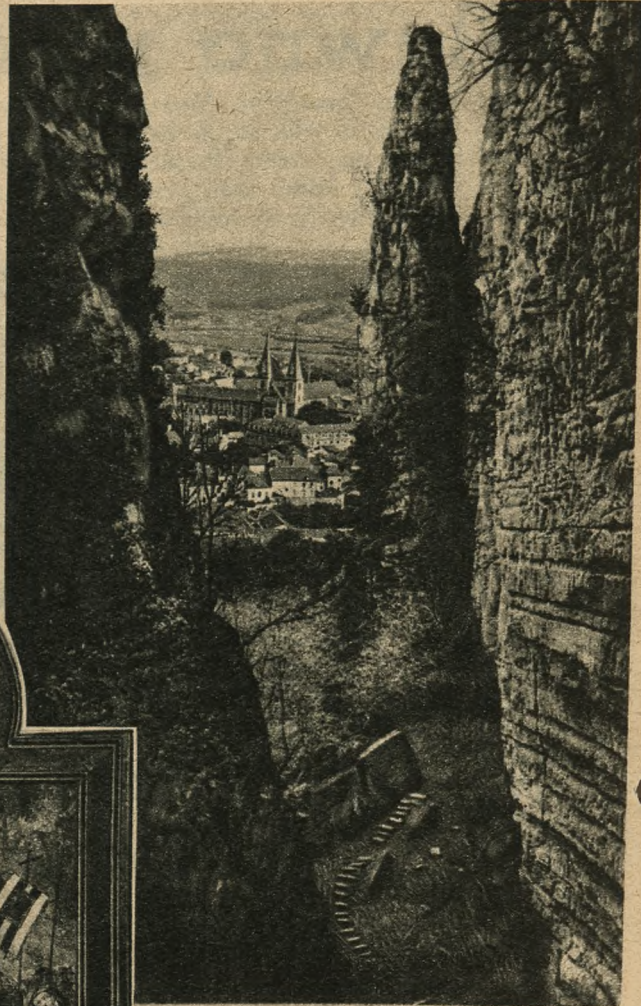
Okolice Echternach obfituje w piękne widoki! Nie bez słuszności nazwano ją Szwajcarią luksemburską.

szkoły, zakłada winnice, uczy ludność gospodarki na roli, lecz ciągle wojny niszczą jego zbożne dzieła. W roku 695 zostaje mianowany biskupem w Utrechcie, w roku 698 przybywa do Trewiru, gdzie św. Irmina, księżna, ofiarowuje Willibrordowi osadę „Epternacum”, późniejsze Echternach. Tutaj św. misjonarz na miejscu dzisiejszego kościoła wybudował klasztor i bazylikę, skąd wychodziły zastępy misjonarzy i kapłanów. Najsłynniejszym uczniem i wiernym pomocnikiem św. Willibrorda był św. Bonifacy, późniejszy biskup w Utrechcie.