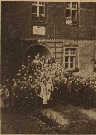
Wycieczka rolnicza kościańska po zwiedzeniu Szkoły Rolniczej Żeńskiej w Tuchorzy p. Wolsztyn woj. poz.

chę finansowo. Bardzo ważną stroną jest jednak program wycieczki, który winien być dobrze przemyślany i dostosowany, aby przede wszystkim obudził zainteresowanie i zadowolenie. Poza tym wycieczka winna być tak przeprowadzona, aby po powrocie dała realne wyniki przez zastosowanie zobaczonych ulepszeń czy też urządzeń we własnych gospodarstwach. Ulepszenia te winny potem przechodzić na dalsze gospodarstwa. Oto jest główny cel dobrze przeprowadzonych wycieczek rolniczych. K.