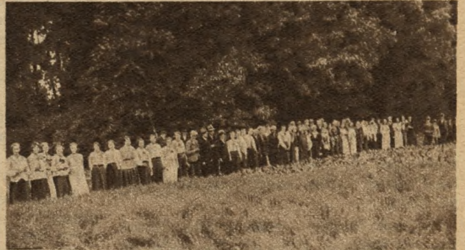
Wycieczka rejonowa zespołów przysposobienia rolniczego młodzieży zwiedza uprawy lnu i buraków w Kopaszewie, pow. Kościan, woj. poz.

Poza szkołą i kursami oraz pracą w organizacjach oświatowych możemy zdobywać dużo wiedzy przez udział w wycieczkach. Wycieczka uczy namacalnie, widocz-