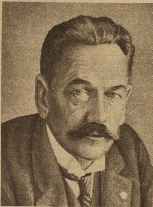
Jędrzej Moraczewski, socjalista, prezes Rady Ministrów od 17. X. 1918 do 16. I. 1919.

wiano między innymi sprawy administracyjne i szkolnictwo, przy czym zaznaczono wyraźnie, że społeczeństwo nasze domaga się szkoły wyznaniowej.