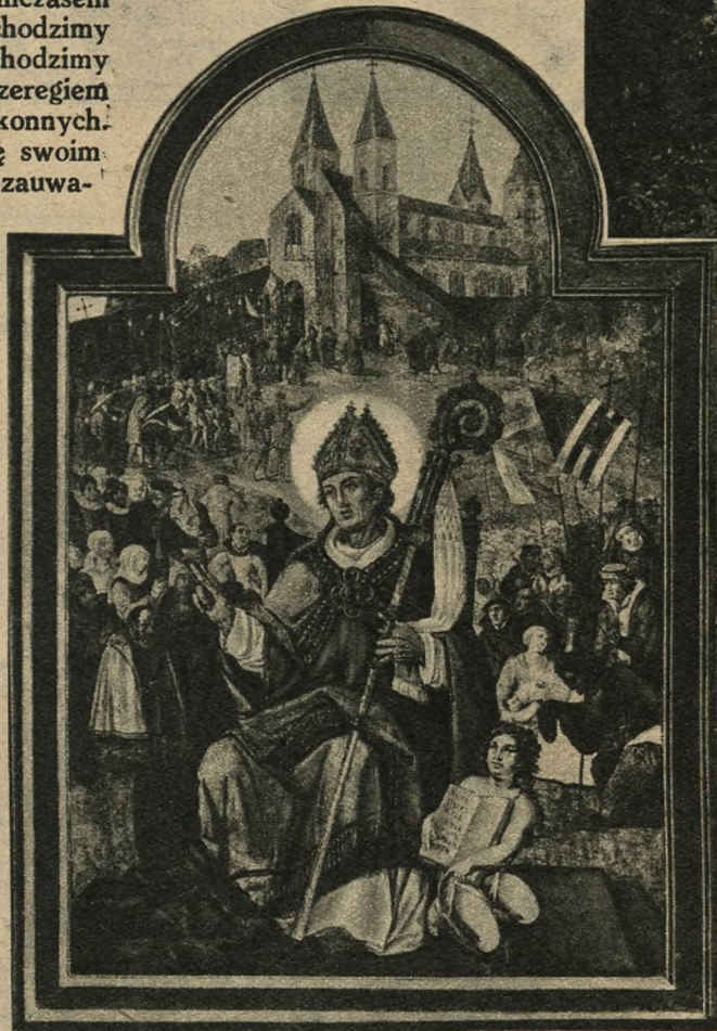
Obraz z wielkiego ołtarza. Św. Willibrord błogosławiący pątnikom.

Przemozna łaska, płynąca od grobu św. Willibrorda, istnieje od niepamiętnych czasów. W roku 657 narodził się chłopiec, któremu na imię dano „chleb życia” — „chleb serca”, czyli „willig brod” — Willibrord. Mając lat 29 otrzymał święcenia kapłańskie i poświęcił się naukom kościelnym. W trzydziestym roku życia otrzymuje 11 towarzyszy i udaje się z misjami do Frygii. Buduje liczne kościoły, klasztory,