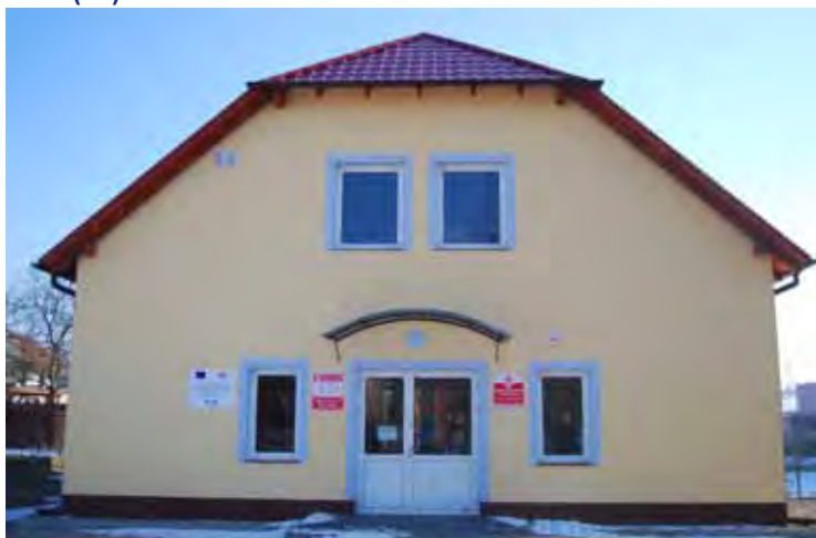
Budynek nowej filii w Bielsku