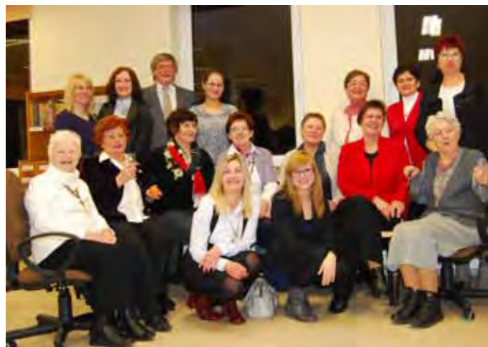
Bibliotekarze powiatu międzychodzkiego