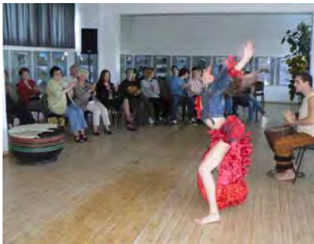
W afrykańskich klimatach