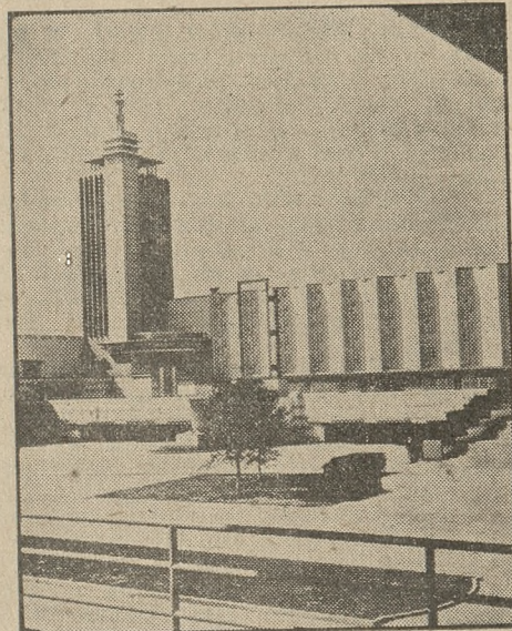
„Pawilon Wiedzy”, z wieżą dzwonów wysokości 176 stóp. Struktura tegoż pawilonu jest arcydziełem architektonicznym Wystawy Stulecia Postępu.

Wystawę Stulecia Postępu zdecydowano urządzić z okazji setnej rocznicy założenia miasta Chicago, od którego to czasu, zbiegiem okoliczności, rozpoczął się szybki postęp wynalazków we wszystkich dziedzinach wiedzy i przemysłu. Sto lat temu, w miejscu, gdzie dziś stoi Chicago, stało kilka skleponych z okrągłaków drzewnych bud, dookoła słabej fortecy zwanej „Fort Dearborn”, również budowanej z drzewa. Dziś, w 1933 roku, widzimy tu miasto o przeszło 3,500,000 ludności, — w tem około 500,000 Polaków, — bogate w handel i przemysł wartości wielu biljonów dolarów rocznie.