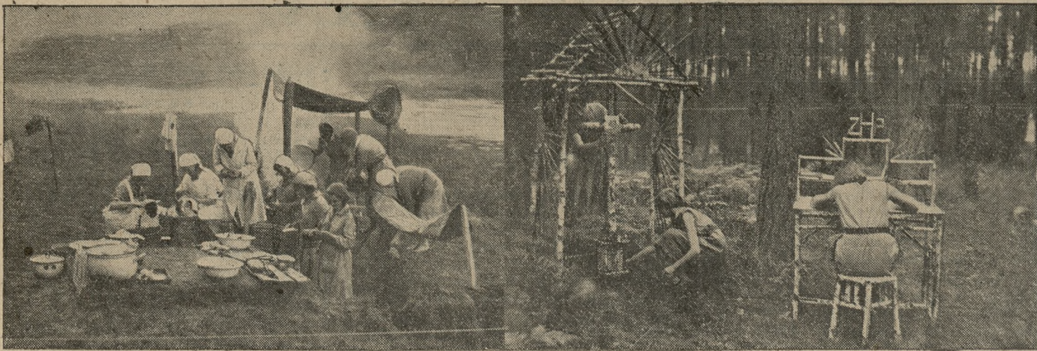
W obozie złotowym harcerek nad brzegiem Warty w Puszczykowie, dymią harcerskie kuchnie. Druchny - harcarki przygotowują wieczerze. Drażki białej brzeziny służą do budowy mebli i stołków. Przy biurku z drażków brzoźowych jedna z druchen załatwia korespondencje. Dwie inne budują piękny ołtarzyk.