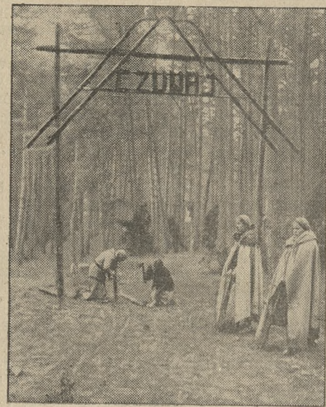
Harcerki - wartowniczeki patrolujące po obozie

mu do Pana Prezydenta Rzplitej i J. Em. ks. kard. Prymasa z wyrazami hołdu od zebranych.