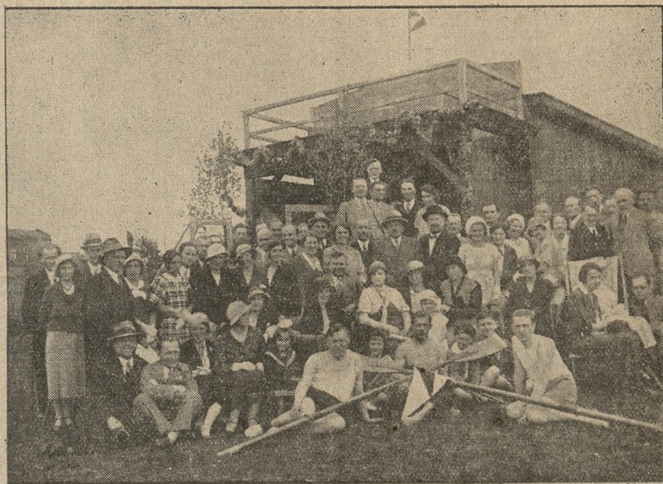
W tych dniach odbyło się poświęcenie szalasu wioślarskiego urzędników P. K. O. Na zdjęciu widzimy uczestników otwarcia, podczas którego dokonano chrztu trzech łodzi wioślarskich.

Pobyt księcia Mikołaja w Grudziądzu był krótki; po zwiedzeniu lotniska, na którym w szeregach ustawione były liczne samoloty rozmaitych typów, goście tą samą drogą udali się w dalszą podróż.