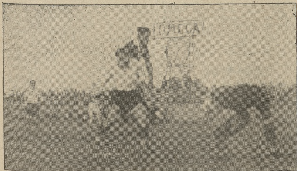
„Warta“ — „Garbarnia 5:0.

— Parowóz zbrzyzany krwią. Na kolach parowozu pociągu nr. 612, zdążającego z Gdyni do Warszawy, zauważono plamy z krwi ludzkiej, oraz szczątki ciała. Wszczęte natychmiast poszukiwania wykazały, iż dalsze szczątki ciała znaleziono na odcinku Gdynia — Rumja. Denatem jest jakiś nieznaną mężczyzna, który w straszny sposób został zmasakrowany przez pociąg. Policja czyni energiczne poszukiwania nad ustaleniem tożsamości tajemniczego osobnika, oraz czy zachodzi tu nieszczęśliwy wypadek, czy też samobójstwo. (dt.)