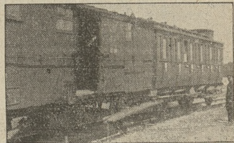
Z katastrofy w Głównej

— WRONKI. (Czerwony Krzyż). — Miejscowe Koło „Polskiego Czerwonego Krzyża” rozwinęło w ostatnim czasie bardzo ożywioną propagandę. Zorganizowano pochod propagandowy i w niedzielę kwestę uliczną. Przy ulicy Poznańskiej urządzono w dwóch oknach wystawę bogato ilustrującą zadania P. C. K. Dnia 8 bm. urządzono wieczorek towarzyski.