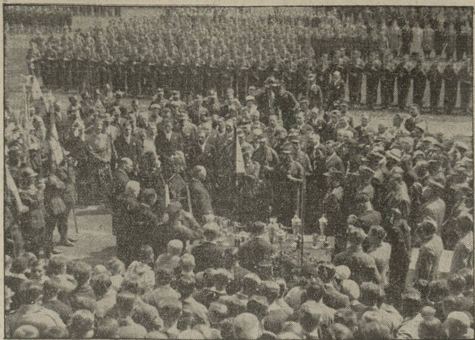
Z wiosennego święta w. f. i p. w.

— Z targu. Dnia 12. b. m. na placu Sapieżyńskim płacono za nabiał: 1 kg. masła wiejskiego 2,40—2,60 zł; 1 kg. masła mleczarskiego 2,80—3,00 zł; 1 kg. twarogu 0,60—0,80 zł; za litr śmietany 1,30—1,40 zł; litr mleka pełnego 20—22 gr; mendel jaj 0,90—1,00 zł. — Za mięso: 1 kg. słoniny świeżej 1,60—1,70 zł; słoniny wędzonej 2,00—2,20 zł; wieprzowiny 1,40—1,80 zł; wołowiny 1,20—1,80 zł; cielęciny 1,20—1,80 zł; skopowiny 1,30—1,40 zł; koziny 1,00—1,20 zł; smalcu 2,40—2,60 zł. — Za drób i dziczyznę: kura 1,80 do 3 zł; kaczka 2—4 zł; gęś 4—6,50 zł; para gołębi 1,00—1,20 zł; indyk 6,00—9,00 zł; perlica 2,50—3,00 zł; królik 1,30—1,40 zł; para kurcząt 1,50—4,00 zł. — Za jarzyny płacono: 1 kg. ziemniaków 6—8 groszy; za 1 kilogram szpinaku 20—30 groszy; za 1 kilogram seleru 60 gr; 1 pececz pietruszki 20 gr; 1 kg. cebuli 20 gr; 1 kg. bobu 40—60 gr; pececz młodej kalarepy 10—15 gr; główka zielonej sałatki 3—5 gr; pececz rzodkiewek 8—10 gr; 1 kg. rabarberu 10 groszy; 1 kg. szparagów 0,50—1,20 zł; 1 ogórek 50—80 gr; pececz młodej marchewki 15—20 gr;