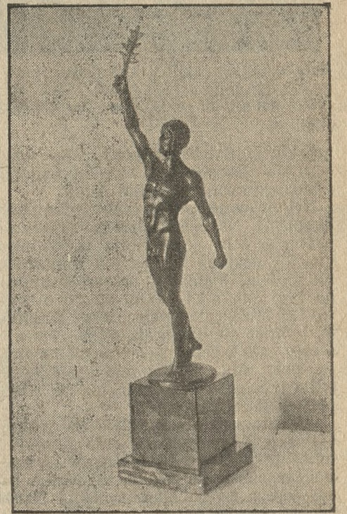
Nagroda „Orędownika Wielkop.“ przeznaczona dla zwycięzcy w „wyścigu międzymostowym“ zorganizowanym przez Oddział Pływacki „Unja“ w Poznaniu w dniu 18 b. m.