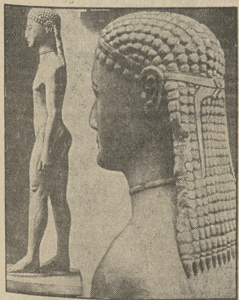
Pomiędzy prof. uniwersytetu w Atenach Arvanitozanosowi a muzeum w Nowym Jorku wybuchł spór o rzeźbę grecką z przed 2 tys. lat. Profesor grecki zarzucając instytucji amerykańskiej nieprawne nabycie tego cennego dzieła sztuki, rości pretensje na 8 milionów zł.

Kurjera Poznańskiego na zwiedzenie Warszawy z wycieczką P. B. P. Francopol do Wilna za opłatą 50%.