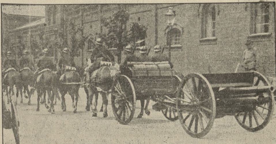
Wspaniałą defiladę zamykał pluton artylerji pułkowej.