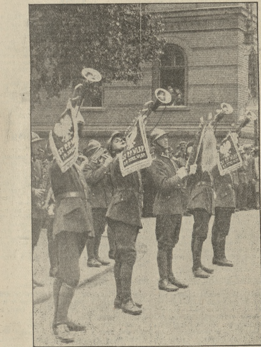
Przy dźwiękach fanfar defilował pułk... Bataljon za batalionem, kompanje za kompanjami...

Wystawa robót ręcznych. Stowarzyszenia Młodych Polek okręgu bydgoskiego urządzają wystawę robót ręcznych w sali Domu Katolickiego przy Farze, w czasie od 25 bm. godz. 12 do 28 maja br. godz. 13. Ekspozyty są bardzo liczne, a wykonane starannie i z smakiem artystycznym.