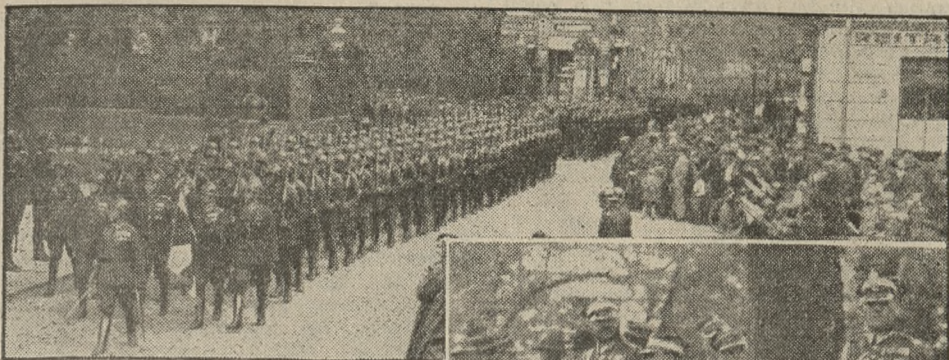
Na czele pułku kroczył poczet sztabowy w asyście kompanji podchorążych. Duma rozpięła pierś wszystkich na ich widok. U dołu generalicja.

Święto pułkowe 57 pułku piechoty — Msza św., defilada, obiad żołnierski i zawody sportowe