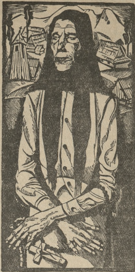
Tadeusz Kulisiewicz: „Kobieta z różańcem” — na wystawie „RYTU” w salonie IMP’U, otwartej codziennie od godz. 11 do 4 po południu.

tu Nowego. Wszystkie występy stały na dużym poziomie artystycznym i zdobyły gorący poklask publiczności. Z uznaniem i wdzięcznością podnieść należy bezinteresowność wszystkich wykonawców programu.