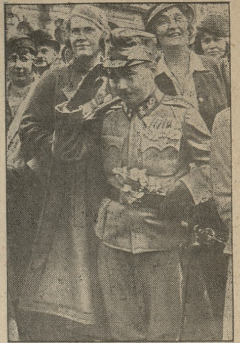
Kancelarz austriacki Dollfuss w uniformie, przyjmujący w Schönbrunn defiladę z okazji 250-lecia odsieczy Wiednia.

(z) Sprzedaż bekonów na rynku angielskim. W ostatnim tygodniu na rynku angielskim uwydatniała się wyraźnie różnica w sprzedaży bekonu tańszego i droższego, mianowicie zapotrzebowanie na towar tańszy było stale większe aniżeli podaź, natomiast trudną była sprzedaż gatunków wyższych, osiągających droższe ceny, stąd też w ciągu całego tygodnia udzielano był bonifikaty, wynoszące od 2 do 4 szyl. Na giełdzie londyńskiej notowano bekon polski w zależności od gatunku od 68 — 72 szyl. Zapotrzebowanie na szynki ulegało również w okresie sprawozdawczym wahaniom. Za szynki polskie uzyskiwano od 69 do 75 szyl. Sfery zainteresowane przewidują, że w ciągu najbliższego okresu zapotrzebowanie utrzyma się na niezmiennym poziomie.