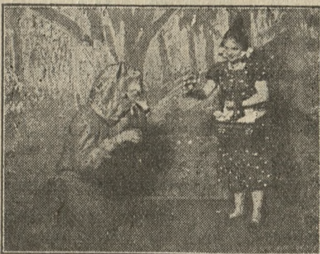
„Czerwony kapturek” — Spotkanie „wilka z Basią”.

„Czerwony kapturek” i „Potop” Henryka Sienkiewicza