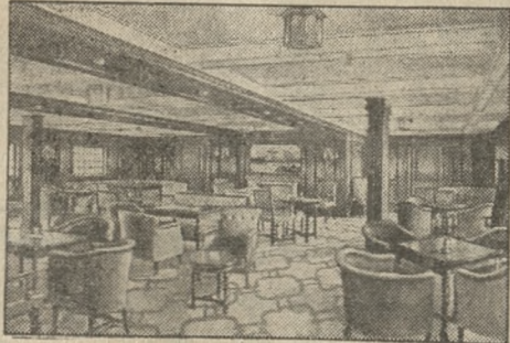
Palarnia na „Stella Polaris“.

Szybko zapadł przepiękny jesienny wieczór. Białe, wysmukłe kadłub „Stella Polaris“ jest przed nami. Prze-