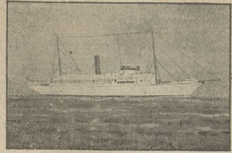
Luksusowy jacht norweski „Stella Polaris“, którego pasażerowie w tym roku zwiedzili Gdynię.

To wycieczka pasażerów z luksusowego statku „Stella Polaris“, odbywającego podróż turystyczną po „stol-