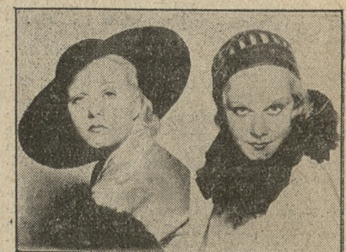
Nadchodzący sezon dopuszcza znaczną dowolność — jak widzimy — w modzie kapeluszy, od wielkich w stylu Gainsborough do maleńkich toczków.

Schmeling pokonał Walkera w 8 starciu przez techniczne k. o.