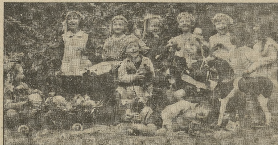
Grupa dzieci z przedszkola.