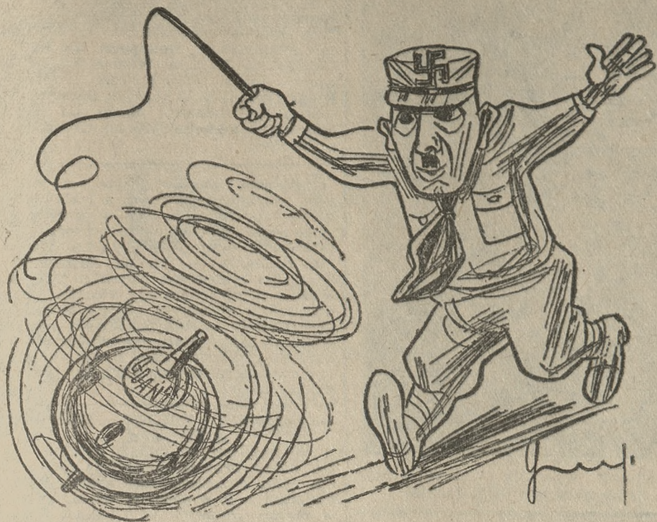
Polski port, czy hitlerowski bąk?