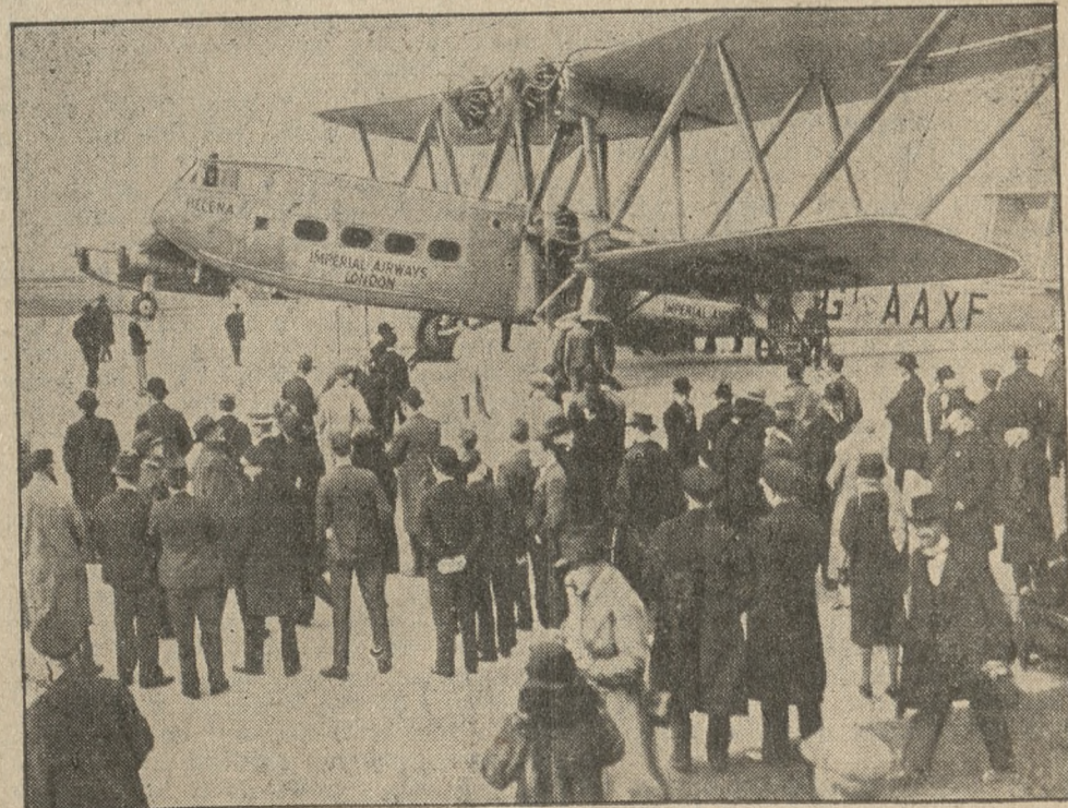
Angielski samolot-olbrzym na 38 osób, który ma utrzymywać regularnie komunikację na linii Londyn — Kapsztadt, wynoszącej 8 000 mil angielskich.

Widownia przeżywa wydarzenia na ekranie z całym przejęciem prymitywnej tłumy. Widzowie krzyczą, gwizdzą, zachęcają głośno do walki, niekiedy do-