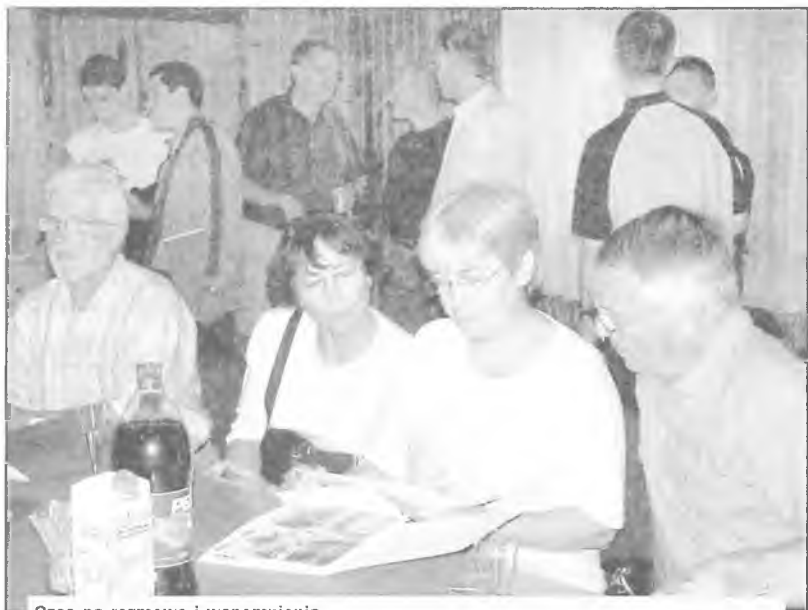
Czas na rozmowie i wspomnienia

zycy w Grodzisku Wielkopolskim. Dziełający przy grodziskim Domu Kultury zespół folklorystyczny przywitał nas polonezem, chlebem i solą oraz polonezem. Prawie dwugodzinny występ przyjęty został przez Francuzów owacyjnie. Był on formą podziękowania dla rodzin bretońskich za gościnność jaką okazały zespołowi w czasie tournée po Bretanii. Warto również wspomnieć, że kontakty grodziskiego zespołu z Bret-