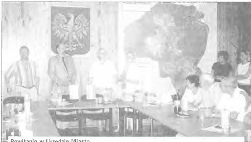
Powitanie w Urzędzie Miasta

Już po raz cztertnasty mieszkańcy naszego miasta oraz partnerskiego Chateaugiron z Francji spotkali się, tym razem w Puszczkowie. Wymiany te odbywają się rokrocznie. W lata nieparzyste w Polsce, a w parzyste we Francji. Gdyby policzyć ich uczestników, to wraz z rodzinami gośczącymi otrzymalibyśmy imponującą liczbę ponad 2 tysięcy osób. Tym razem 33 osobowa grupa naszych francuskich przyjaciół przebywała w Polsce od 11 do 21 lipca.