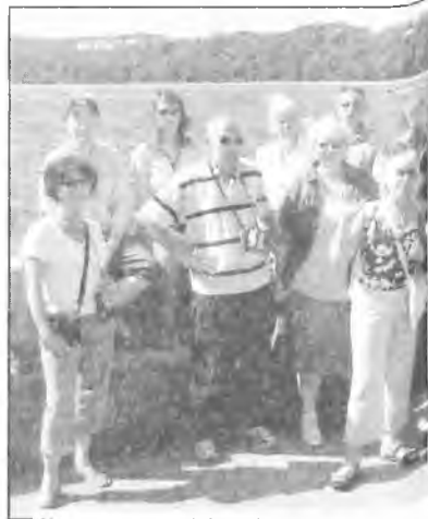
Na Skwerze Kościuszki w Gdyni

zycy w Grodzisku Wielkopolskim. Dziełający przy grodziskim Domu Kultury zespół folklorystyczny przywitał nas polonezem, chlebem i solą oraz polonezem. Prawie dwugodzinny występ przyjęty został przez Francuzów owacyjnie. Był on formą podziękowania dla rodzin bretońskich za gościnność jaką okazały zespołowi w czasie tournée po Bretanii. Warto również wspomnieć, że kontakty grodziskiego zespołu z Bret-