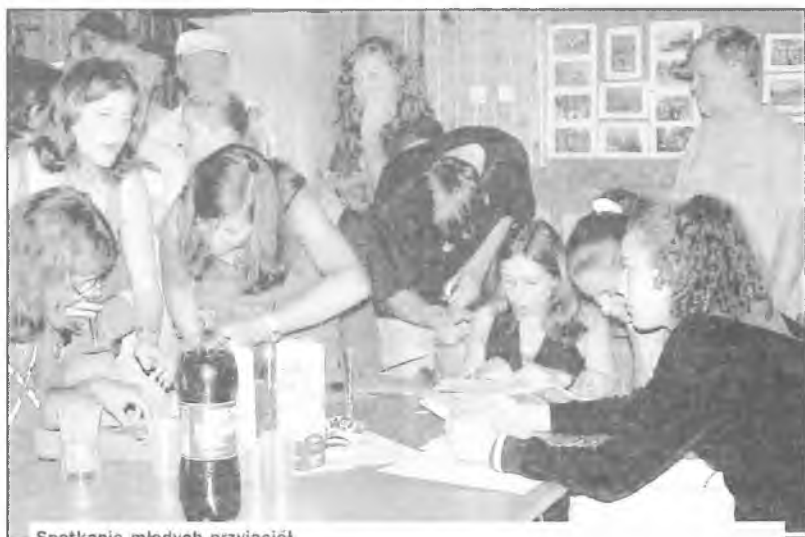
Spotkanie młodych przyjaciół

udziałem rodzin, które przyjęły gości z Bretanii pod swój dach. Wspólnie wznieśmy toast za przyjaźń i następnego dnia rano ze smutkiem, a zarazem z nadzieją spotkania za rok, żegnamy naszych gości. Do zobaczenia w przyszłym roku! Już po raz piętnasty. Korzystając z