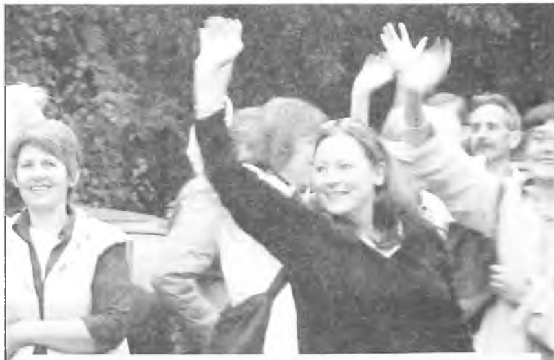
Do zobaczenia za rok

Chateaugiron zaprasza uczestników w Klubie Seniora w Puszczykowo- Podstawowej nr 1) 16 września o przyniesienie zdjęć z tegorocz-